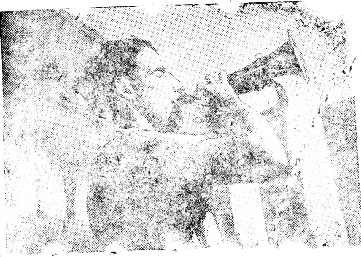
Барселоона, Каарл-Маарксийн нeрeмзeтe кaзaармaдa гpнист доxioo yгeзe бaнa.