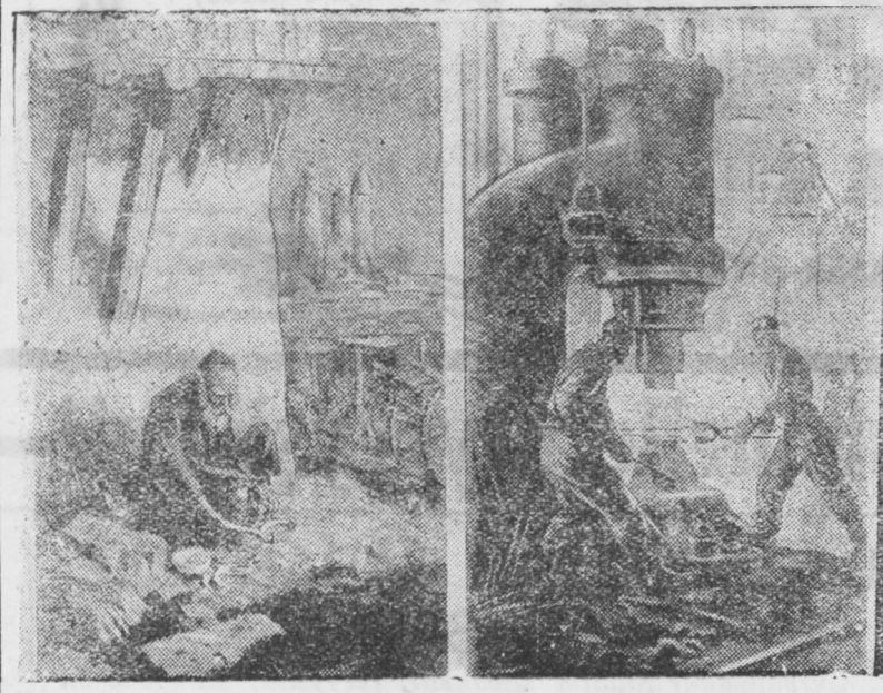
Xuuxan sagta asal geese xynde xysher zoblongoi oron baigaa. Mynoo sagta asal geese sengelig xyxiyy, hainaldarai oron boloo. ZURAG DEERE: „Kyz-neec—Kystaarig“ ZURAG DEERE: Tat-selbmasг zavoodoi kyzneec-ne ceex soo.