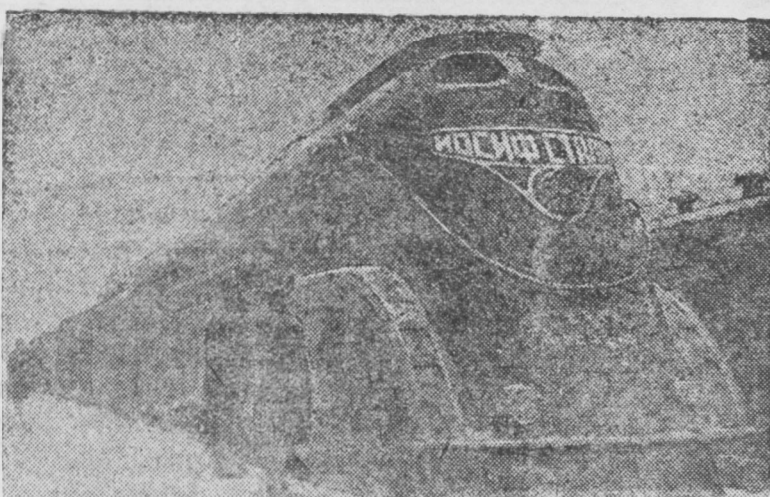
„SSR ei socialistis tymer zamai transportiin 20 zilei oin“ viistavkada, Oktiabriin revolyyiin neremzete zavood deere (Vorosiilovgraad) byteegdehen „Iosif Stalin“ geze sine pasazir provooz jirehen байна. ZURAG DEERE: Provooz „Iosif Stalin“ viistavkada байна.