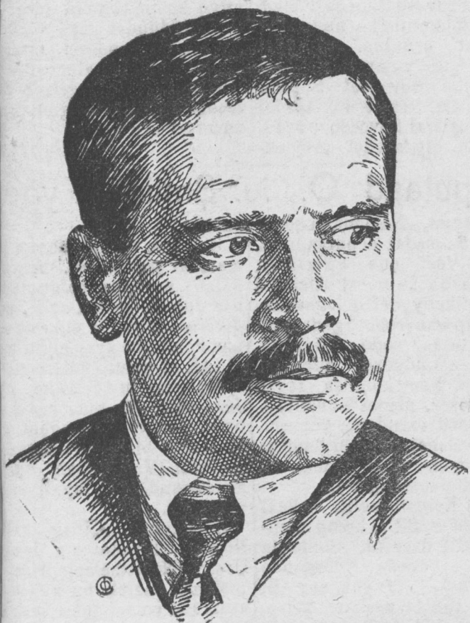
Sojuuzai Soveedai tyryylegse nyxer ANDREI ANDREEVICH JEVIC ANDREEJEV.