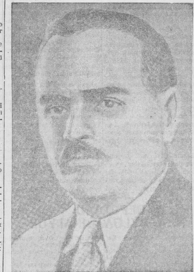
Nacionaalinostinuudai Soveedai tyryyleгce nyxer N. M. SHEVNERIG.