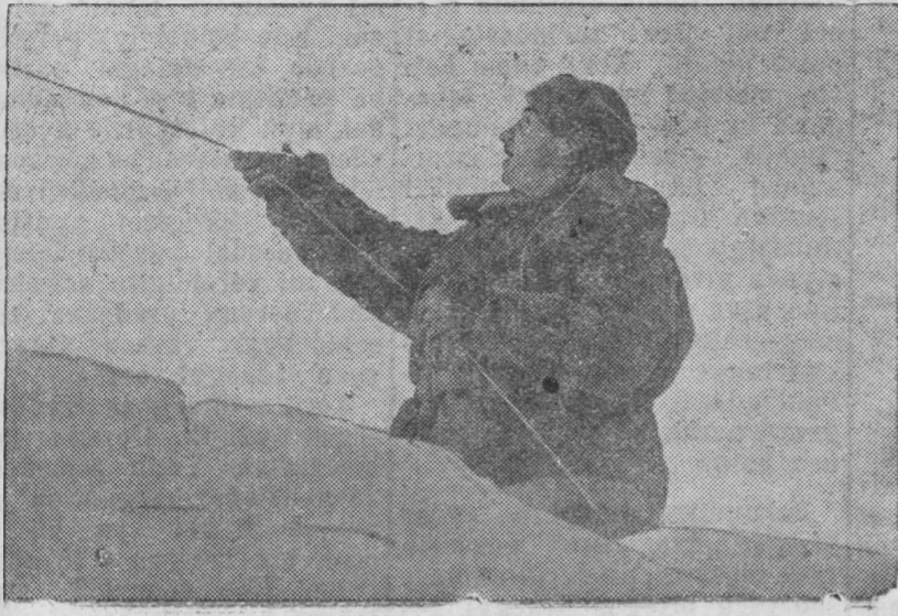
ZURAG DEERE: „Xoito pooliusal raadiostaancin xydelmeriin dyrhenei hyyleer, I. D. Papaanin antennaa abza baina.