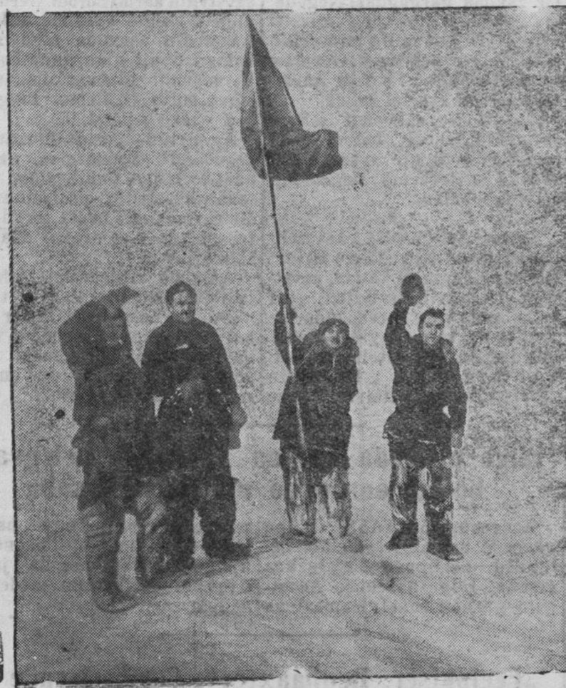
ZURAG GEERE: Gerois dyrben Papaanintan bolbol „Taimir“ ba „Myyrmanii“ ugtaza baina. (Sojuuz foto).

„Gorodto yni udaan sag-soo hain yderei abiaan tahar-nagyi.