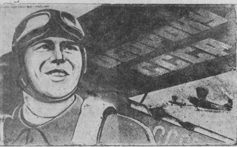
Osovixiimai 12-xi lotoreina bileedyydii amzal-taigaar taraaxiin tula, osovixiimai Centraalna Soveed bolbol eldeb haixan plakaduudi gargahan baina. ZURAG DEERE: Xydoonig A. Beelşkiin zurahan plakaad. (Sojuuz foto)

RSFSR-ei Arkomsvoxoosuudai sovxoozuud bolbol gyren-de hy tuşaxa ene onoi tyryy-şin kvartaal plaanii 101,6 procent dyrgyehen ba miaxa-nal tuşaalgi—115,1 procent dyrgyebde. 930558 ceentner hyn gyrende tuşagdaza, yngerege-şe zile tyryyşin kvartaal zışeelylyxede 41 proc. jixe bolhon baina. Miaxan bolbol ene kvartaal soo 156499 ceent-ner tuşagdaa, Yngerege zil-dee oroxodo 181 procent jixe tuşagdaa. (TASS).