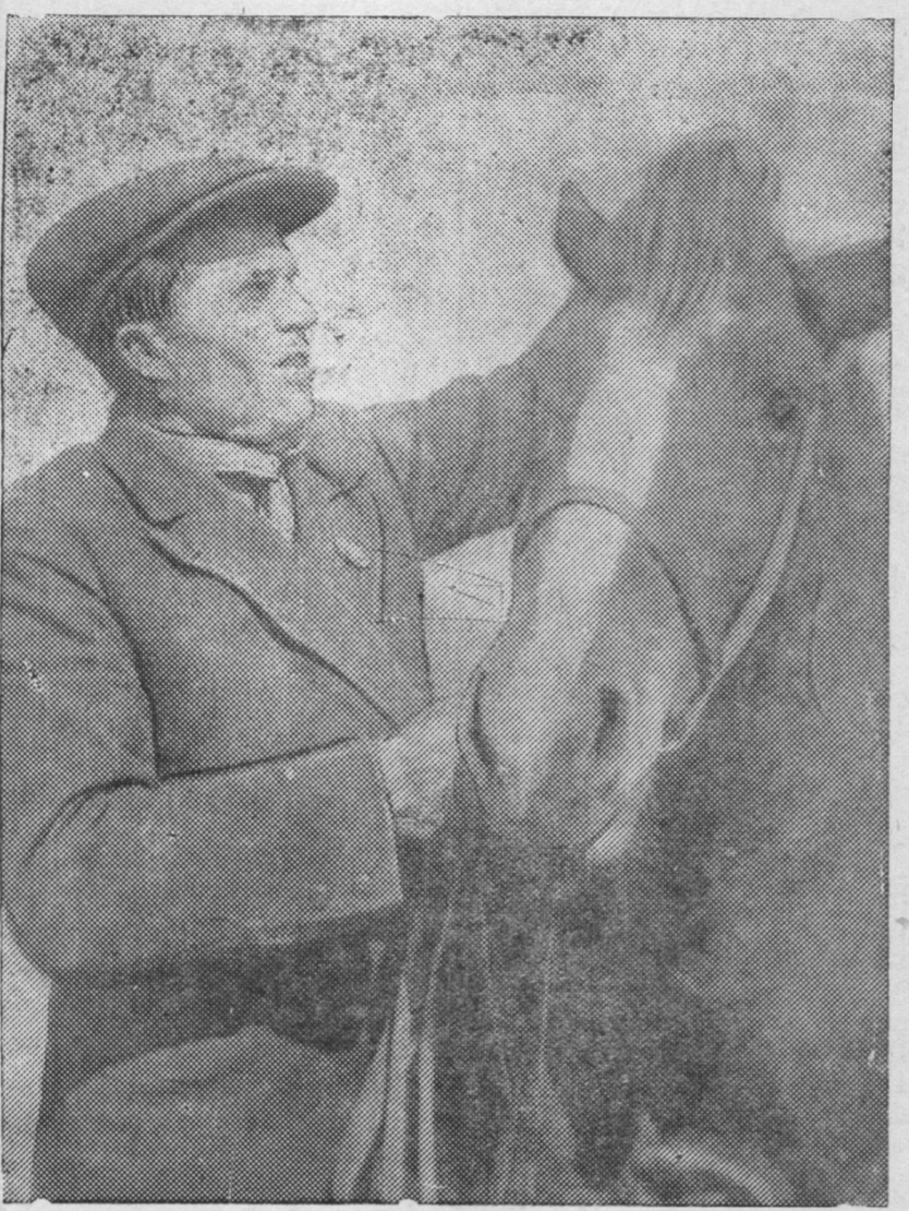
ZURAG DEERE: „Pobeditel“ kolxoozi (Kynaliin) morişon oordento nyxer Syçkov J. I. gegşee „Boiijaka“ geze gyinei xazuuda baina. Şernoovoi foto.

Sojuuzna ba avtonoomno respyyblikenyydei Verxoovno Soveedai hungaltanuudta beledxel. Tarilgada hain beledxeltei selpoo. Soveed Sojuuz dotor. Respyyblike dotor.