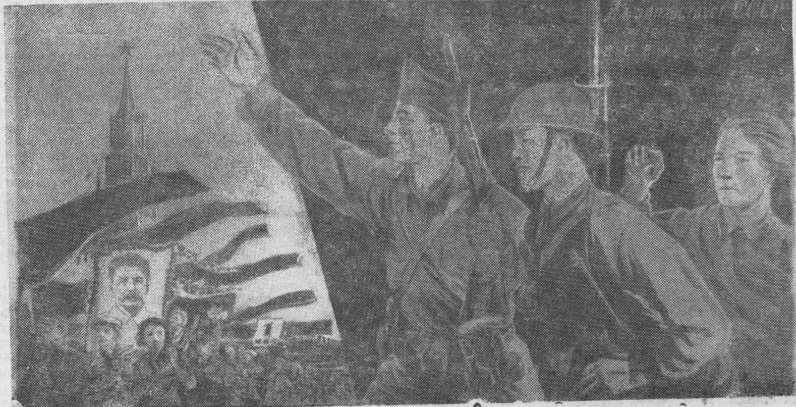
ZURAG DEERE: Main 1-de zoriuulhan, „Byxii delxein azalşadai esege oron—SSSR mandag!“ gehen, xydөөznig.

Terbee 1931 ondo manai respuybliktin poolinuud deere bolodoo 30 traaktor xymerilee baigaahaa, mynөө 1938 ondo 1387 traaktor dalmerilne. 1931 ondo manai kolxoozuudaar ba MTS-adaar negeşii avtomashiina kombain ygei baigaahaa, mynөө 182 avtomashiinanuud 1934 kombainuud xydelmerilne.