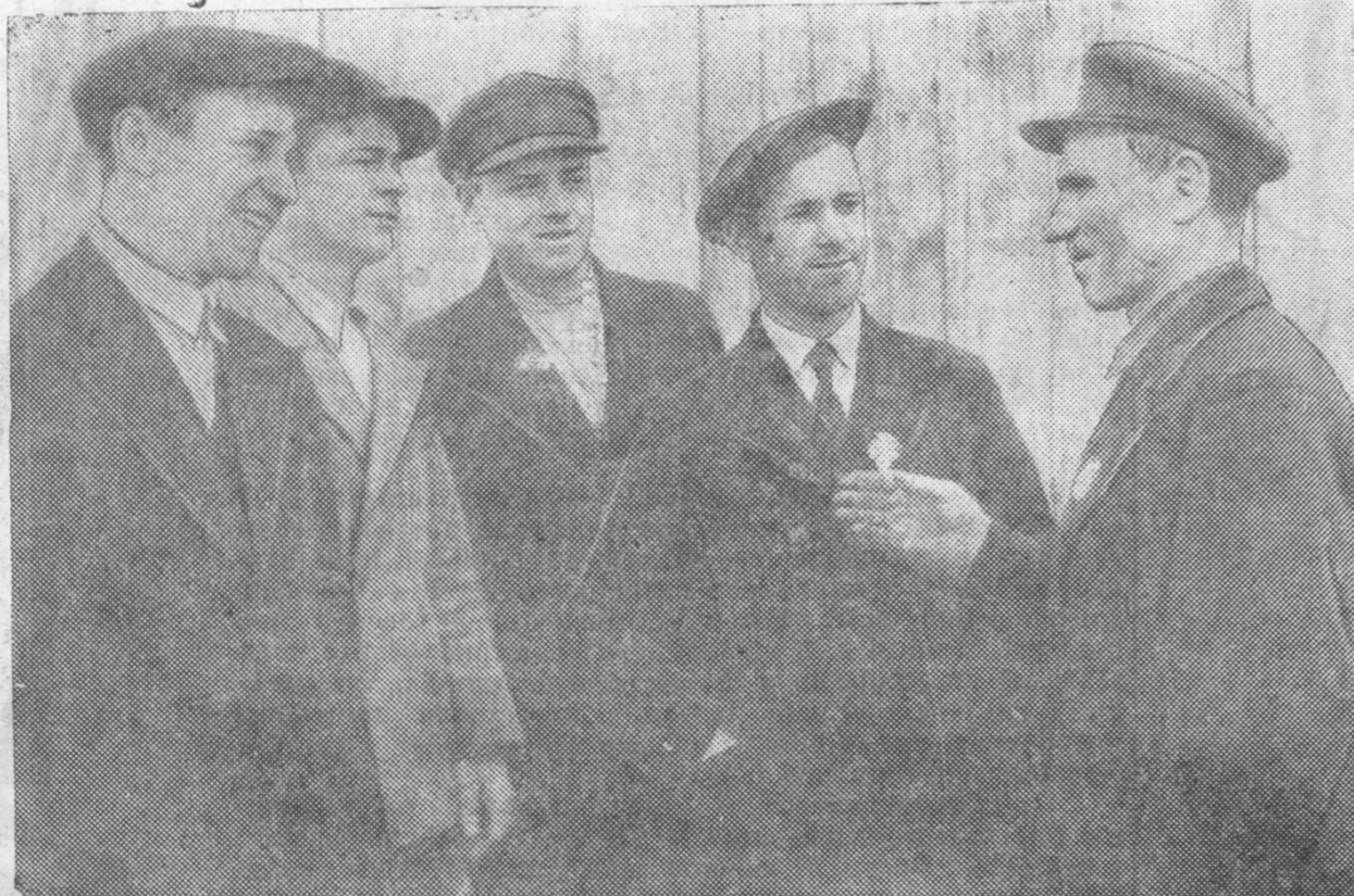
Zyyn-Sibiiriin tymer zamaі 13-daxi distaanciin staxaanovtan-kyznicecuud.