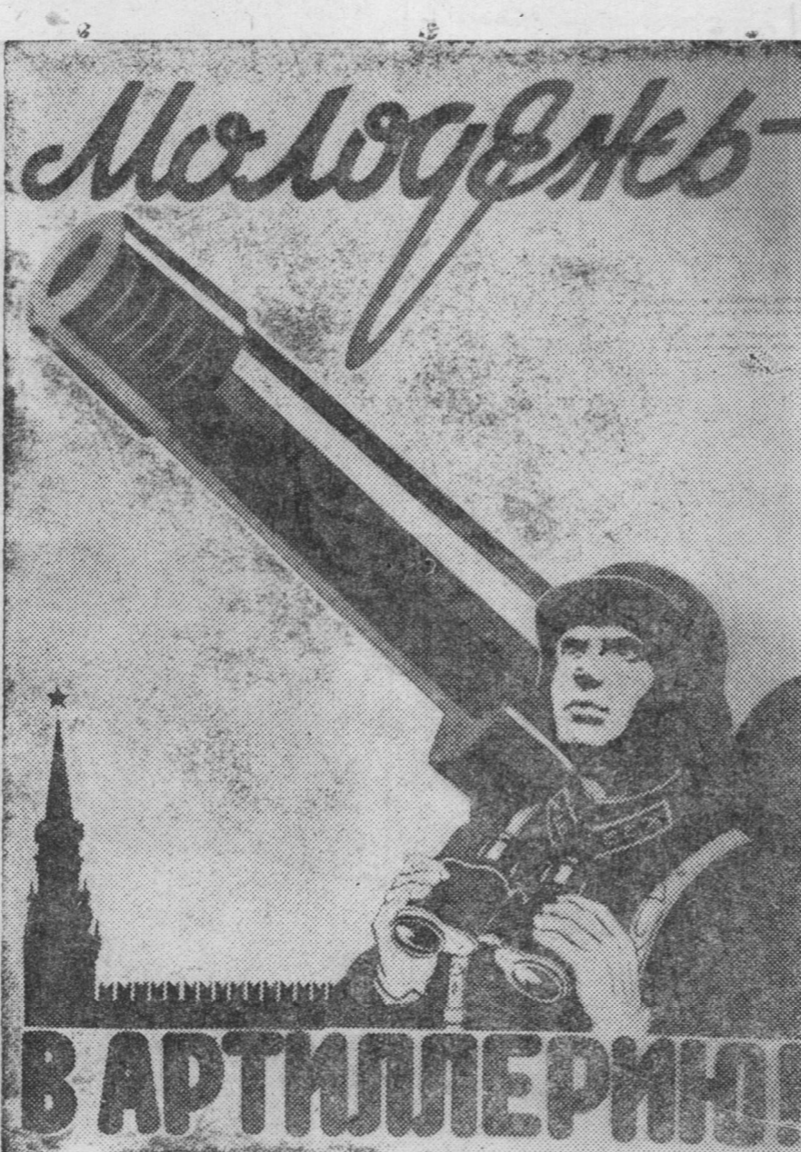
ZURAG DEERE: Gyrenei vojeenne izdaatelstva gargagdahan „zaluusuud artilleride“ gehen plakaad Xydoozniguud, V. Briiskinei ba V. Fomitjevai xydelmeri.

20. „RSFSR-ei Verxoovno Soveedte hungaxa hungaltiin tuxal dyremel“ 41 ba 42 statjanuudtal zoxilduulan byxii pristanuud deere hunguuliin ucaastogudijii emxidrexe ba komissanuudai sostaavijii batalkiis niutagal soveedydte zybsoexe.