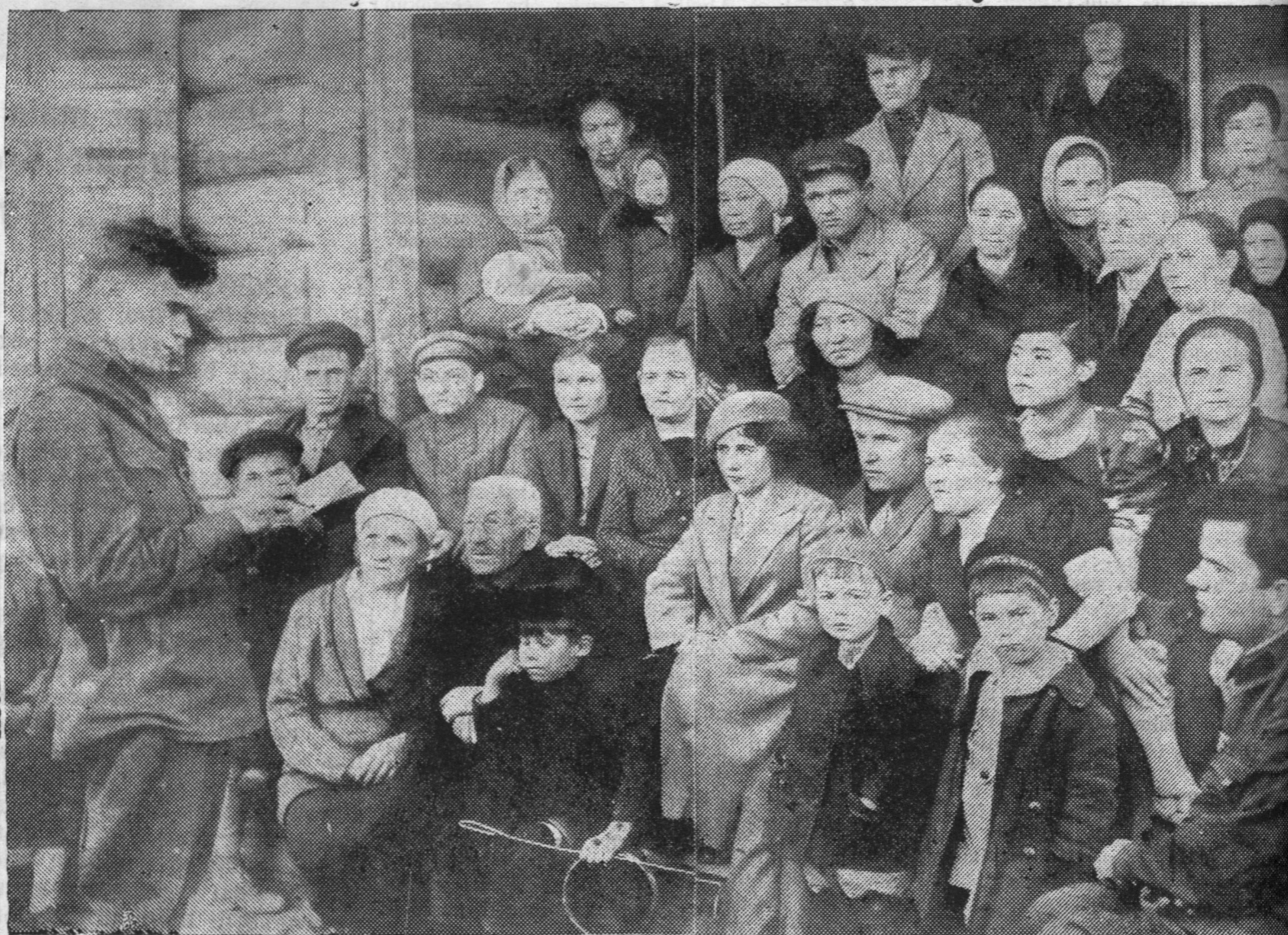
ZURAG DEERE: Ulaan-Yde goorodoi Sverdloovsko ylicede bairtai azalsadai dunda emxidxegdeh RSFSR-ei ba BMASSR-ei Konstituucanuudijl huralsaxa kryzoogoi zanaati. Ene kryzoogijl nyx. A. G. Lyygovski xytelberildeg байна.

Xamtiin suglaan bolbol BMASSR-ei Verxoovno Soveedei deputaaduudta Sajantiin hunguuliin ookrug soo ballotiivalagdaxa eehediingee zybseolee ygexiijl nyxed Ivanovijl, Diominijl ba Sergejevitch guina.