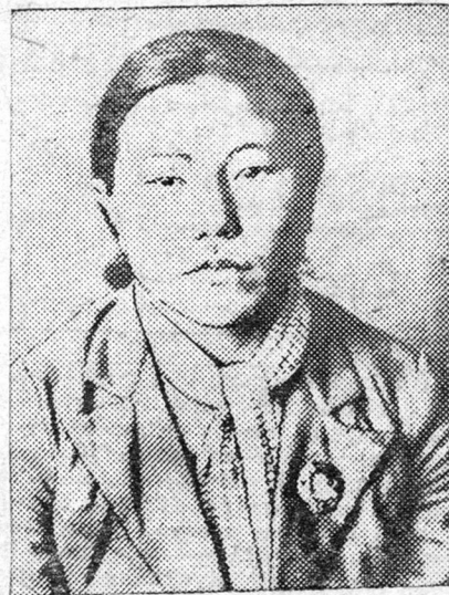
gaigaa negen xynde xadamda garhan baina.