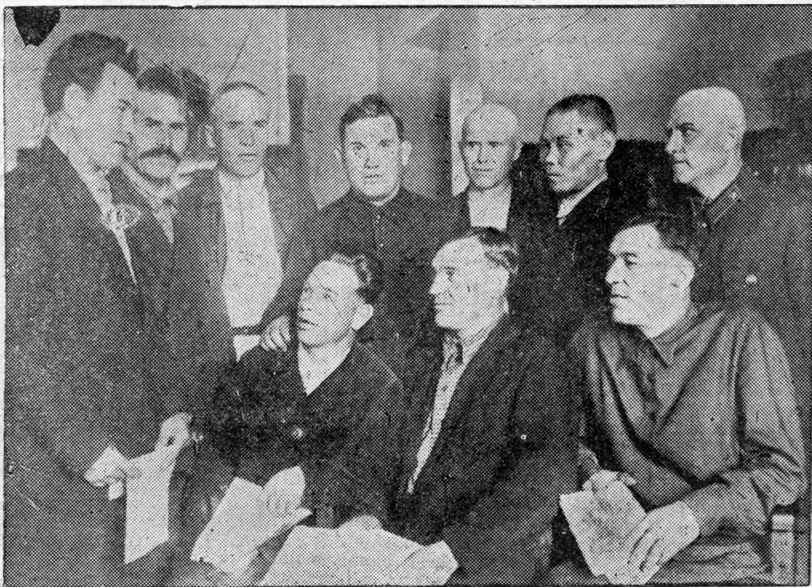
B.-M. Oblastnoi partkonfereenciin byleg delegaaduud.

Ignaatsjev bolbol agitaaca, propagaanda ba xebelei tahagai xytelmeri tuxal bagaar xelee. Partiina propagaandiin xytelmeri tan hula baina. Aimag ba k o l x o o z u d a r poliitişeske ba-ga beledxeltei kommunistnuud olon baina. Teed, Obkoomi agitaaca, propagaanda ba xe-belei tahaghaa mynee xyrtter tuhalmaza abtaagyl.