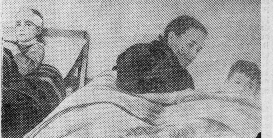
Respyblikeaaska Ispanida ZURAG DEFRE: Фашис vaарvarнуудai Taragooniiji боо нбодонони hyuleer, шaxатаашад гооспитальда xeбteze байна, (Sojuuz фото)

Moskeryeel seekortе respyblikeaануудai zenитne батареi болbol фашис самоллооудiji буудahan байна. Pilood-italъjaанec шатаа. Myn, Альbokaasa рaiоондо фашис самоллооуд буудagдан байна. Neemecyydhee byридеheh екoпaазань pleende abтаba.