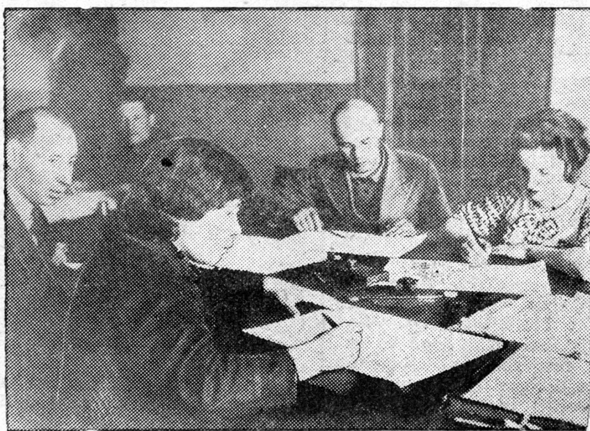
ZURAG DEERE: Goorodoi Soveedei dergede huragsada spioogijii zoxiooxo 5 brigaada xydelmerilne.