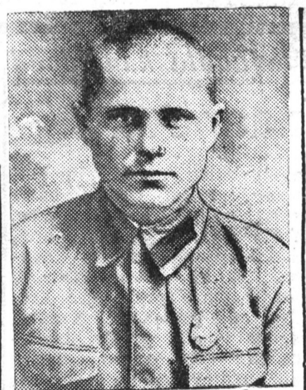
Vasilii Antoonoviç Soroçaan Tamiirьska hunguuliin okrug soo ballotiivalagda-xanb.

Sojuuzai deede nagraada—Azalai Ulaan Tugal oordenoor şagnagdahan.