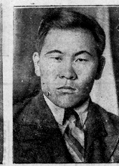
BMASSR ei Verxoovno Sove-dei Prezidiimeı sekretarş nyx. V. M. Birtaanov.