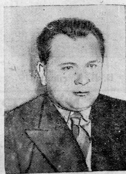
BMASSR ei Verxoovno Sove-dei Prezidiimeı tyryyleşgiin negedeger orologşo nyx. I. I. Volkov.