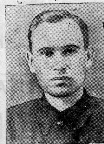
BMASSR-ei Verxoovno Sove-dei Prezidiimeı tyryyleşgiin xojordugaar orologşo nyx. I. I. Toçilov.