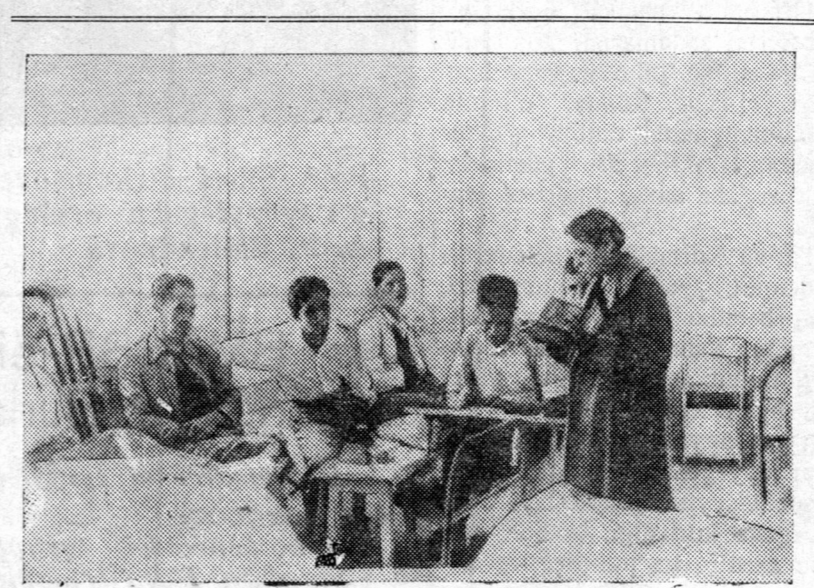
Respyblikaanska Ispanida. ZURAG DEERE: Vojeenne goospetalnuudai negende edegeze baihan, bojeecyyḁte hurgagḁa bolbol nom unḁaza ygeze baina. (Sojuuzfoto).

Pariiz, 9. (TASS). Kordoov to bolhon hajlin vostaanital ḁasaramduulan, miatezngyyde oficeernyydei dunda aarest xegdee geze, Espann aagenst y medeese. Aarestalulag-dagḁadhaa 32-nḁ Fraankoda esergy zaagovorto xabaadal saba geze zemelyyegdeze, buu-dan alagḁada.