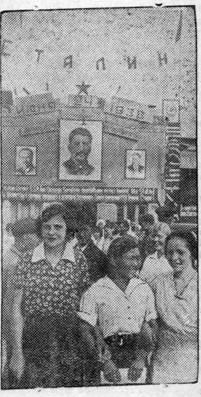
ZURAG DEERE: Kirgiişke SSR ei Verxoovno Soveedte hungaxa hungaltiin yder, zaluu hungagşad—ojodoloi faabrigai emegtei xydelmerileşged bolbol gotosovaal-hanaigaa hyyleer, hunguuliin-gaa uçaastogaigaa gerhee gar-za baina. Ene ookrugto nyx. I. V. Staa-lin ballotiivalagdahan baina.

Bolzo yngerhen, ene olim-piaada bolbol Buriad-Mongol ASSR-ei kylştyryne ba tvoor-çeske talaaraa nelieed jixe ilal-tatal bolhişins xaruulna. Ge-xiin xamta, Selengiin, Jaruu-iniin, Kabaanskiin aimaguudai xytelberileşged bolbol aradai uran haixanai tvoorçestviin ai-xabtar jixe poliçeşke udxa-şanartal baibaşil, tereende xariusaigagylgөөr xandadag baihiinş temdegleşе xeregtei. Eae aimaguudai ba myn ter-eselen, bişeşji aimag raşoo-nuud bolbol aradai tvoorçest-viin xereglişi erxim hainaar xytelberileşе johotoi.