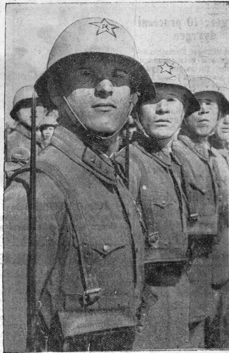
Moskvaagai seregei ookrugoi N-ske caastiin huralsalai zaniaati. ZURAG DEERE: Tyryysiin zergede (zyyn teehee)—bo- jevoi ba poliiticeske beledxeleere otiliicnij nyxer Solov- joov baina. (Sojuuzfoto).

Ijylytiin 30-da „Jyynkers“ geze germaanska samollooduud- dai eskadriilnyydei Reys goorodijij ba Ospitaleet dereev- nilijij bombodohonol eseste, ene pynktnyydeer olon ger- nyud butasoxigdohon ba graz- daanska aradzonoi dunda olon xynnyd yxehen ba šaxatahan baina. Myn, eneen soo exener- nyud ba xygyed bil.