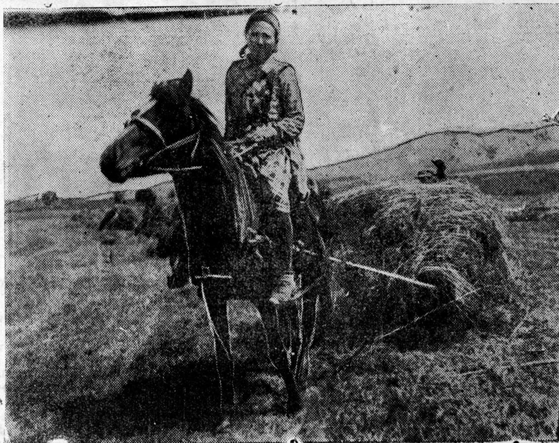
ZURAG DEERE: Tarbagatain aimagai „Kraasna Partizaan“ kolxoozdo ybehe xuriaalga jabaza baihan tuxai.