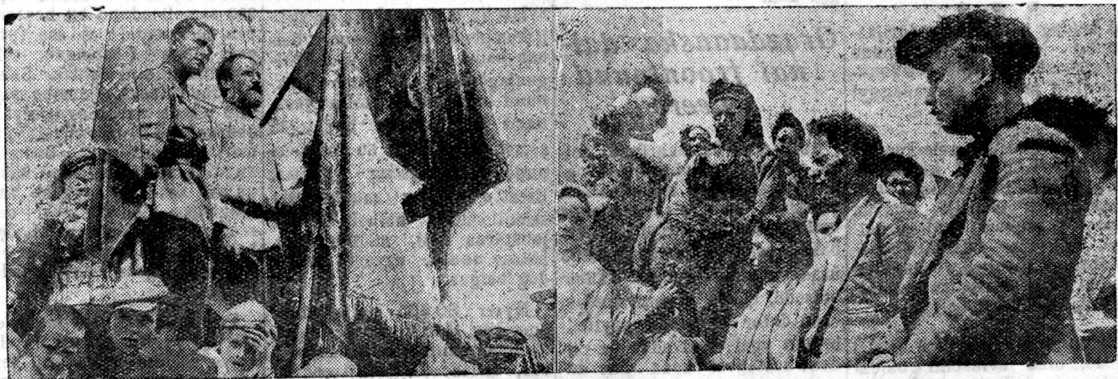
Tarbagatain aimag bolbol 1938 onoi xydee azalai xydelmerinydilji amzaltatai dyrygeheneigee tyloo, BK(b) P-iin Obkoom ba BMASSR-ei SNK-ai damzuulgiin Ulaan tug abba.

Zakaaminai aimagai, Utaata Dalxain somonoi, Kaganooviçilni neremzete kolxoozoi, şanarilji şalgagşa inspektor Bambun Garmin geşşе, kolxooziguudai xehen xydelmerinydilji şalgaza yzixin tulada, negeş anxaralaa tabinagyl. Eneenei rezylştaadta, ybehe sabşalgin şanar muu baina. 1937 onoi tariia soxilgiin hyyleer, „molotilkoo“ sagaan talada zaxahantyn, ziberşehen baina. Eneeniin inspektor Garmin medese baibaş, jamarşilji xemşee abaagyl baigaa. Telefon.