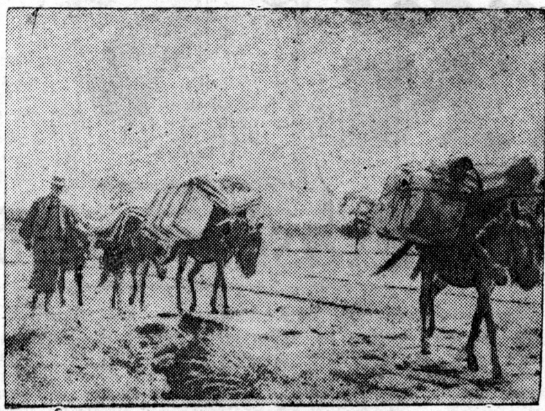
Xitad arada! azabaidal ba huudal. ZURAG DEERE: Juanaans proviinclin gooroduudta oozoo jабaa medikaamentnuud ba tovaarnuudtai karabaan (Sojuuzfoto)

Manai respyyblike dotorki partiina organizaacnuud bolbol BK(b) P-iin CK-er haiaagadahan staalinska sesen nauucna tryyd, —egeel revolycioonno paartiilji baiguulhan oopediiji xamtad-xahan ba bolshevitzmiin aguu jixe ideine bajalgilji sugluulhan, BK (b) P-iin istooriin xuriaangii kyyrsilji gyznegigeeer sudalxiin tyløe beledxelei xydelmerilji jabulza exilhen байна.