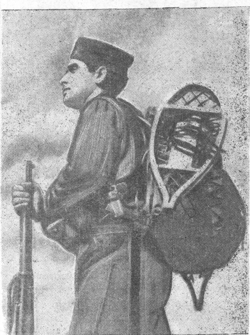
Respybikaanska аармиин боjeecyyd тон xынде берхе yсloовидo дайла- на. Гынзегий jixe сахаар xусгадahan xадануудта хелхее холбоонoi с- пeциaльнa oрiадaдууд емхидгeдeнxel. ZURAG DEERE: Гынзегий сахан соогуур перeхoод xexiin тулада илзеер хангaдahan, respybikaanska аармиин швизийст. TASS-ийн фотоxрооникo.

Partiina, профсоюзна ба азaxiin оrгaнizaцaнyуд болbol правителствин, паартийн CK-ai ба PSBCS-ei тогтоолой агун jixe политическе удхашанарийг xydelmerised ба albaxaagsad byxende тодорхон олгуулха улгалтай. Лoдeрнyудтa адми- нстративна хемзее абхатай зо- хилдуулан, сeрjooзно маассo- ва xымызeлeгийн xydelme- ri болbol xydelmeriin saglijii хо- оор геесе, азалай disciplinijii bydyijigeer xazagalуулxa жа- badaltijii есeлeн боллуулxa арга олгозо үгехе. Zakoonor бай- гуулгдahan xydelmeriin yде- рел prodолителствинийг xyse- деер хереглeгe болbol promишeннee продукциин шине ургалта гаргaxa, gyrenei үчредеенүүдeй xydelmerijii зурамсуулxa ба манай оронoi обороонно садабар ба азaxiin xyse садалийг саашан бeхизийлxe jabadalta jixeer тухай геесе. („Правдита“ тырүү бйсгeгe)