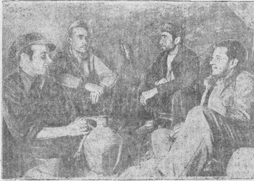
Respyblikaanska Ispaania. ZURAG DEERE: Respyblikaanska aarmiin bojeecyid baldaanaal xoorondo amaraza baña.