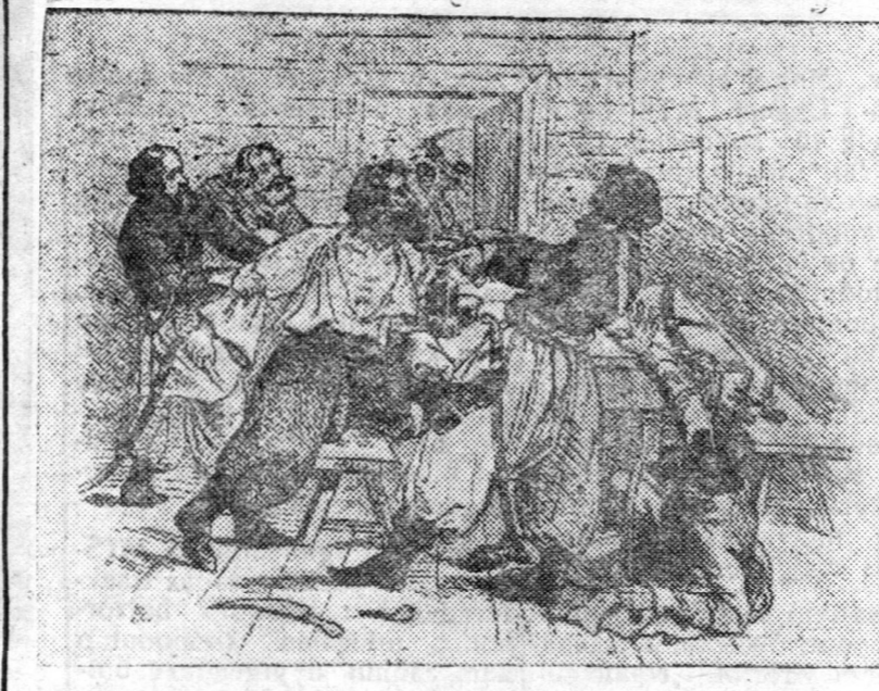
Агуу илэе Украинска поед—революционер Т. Г. Шевченк in tyrehenhe xoišo 125 zil болhonoi jыбилеide. ZURAG DEER : „Pyгač.ови ji aarestaliga“ геze, T. G. Ševčeenkiin зурахан зураг.