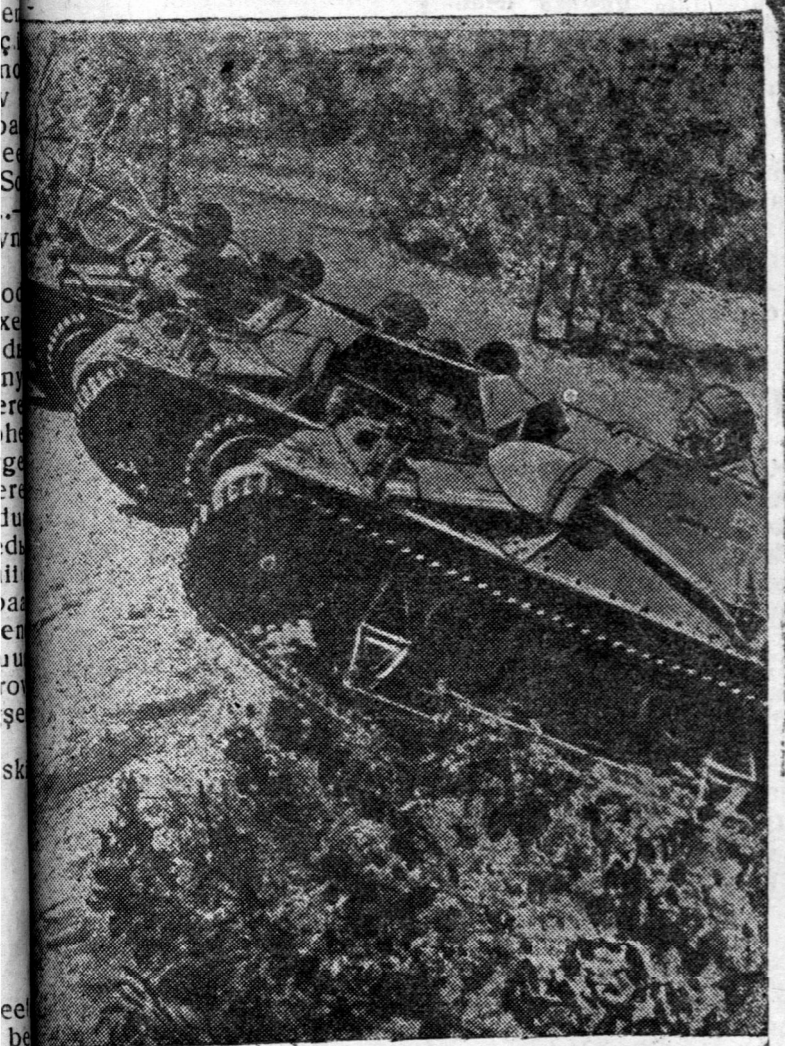
ZURAG DEERE: Kanaadka aarmiiln taankanuud malaverte Jabana.

—2,8 proc. xoroltotol, Porgoin somonoi Moolotovoi nemzete kolxoozoo tugainuud—15,5 proc., unagad—9,4 proc., xuriga eşeged—35 proc. g. m. xorolto bolhon baina. Deere dursagdahan kolxoozuudal olonxins xadaa socialis malazal deere şadabarital kaadran d—taxaanovcuud, ucaar-niguudilji tabiaagyl, sildee, haradaa feermin xeden olon erxilegşedilji helgehen ba malazada xaişa xereger xandahana rezyltaadilji xaruulna. Zişee xeece, Porgoin somonoi Moolotovoi nemzete kolxoozoo tyryylegşeer xydelmerilee balhan Cer-enov xoninol feermin erxilegşe Cerenz apov, aduudal feermin erxilegşe Gomboojev gegşed us kolxoozoi xyşeberilee udzan bolzo. soo baixa zuura malazal deere jixen vreditelşevte bolhon baina. Iime faaktanuud bişejli kolxoozuudta olon bil. Aimagal xeden olon kolxoozuudta vreditelşevtin xoişolon-guudal u adxalgin hulaar jabasa ba zarimdaa vreditelşevtiin yrgelzelheer bahaan tuxal şignainuudal aimagal organizacanaunaa, ilangajaa AZO o xedil olon orohonşil haan, edenel xytelberilegşed, eeen tyryyn AZO-goi exilege Zalcev ba ştaarşaa zooteexnig Blişenko gegşed şixe dylin huulşaza, ede daisan elmeentnyydetel jixeg tuha amza ygeş geş. Socialis mala aliilji gartaa abaza 1939 on soo gyrenel plaaniilji ylyyb-elen dyrygeşlin şuxala xemzeşil abxa johotoi. C. Zimbееjev