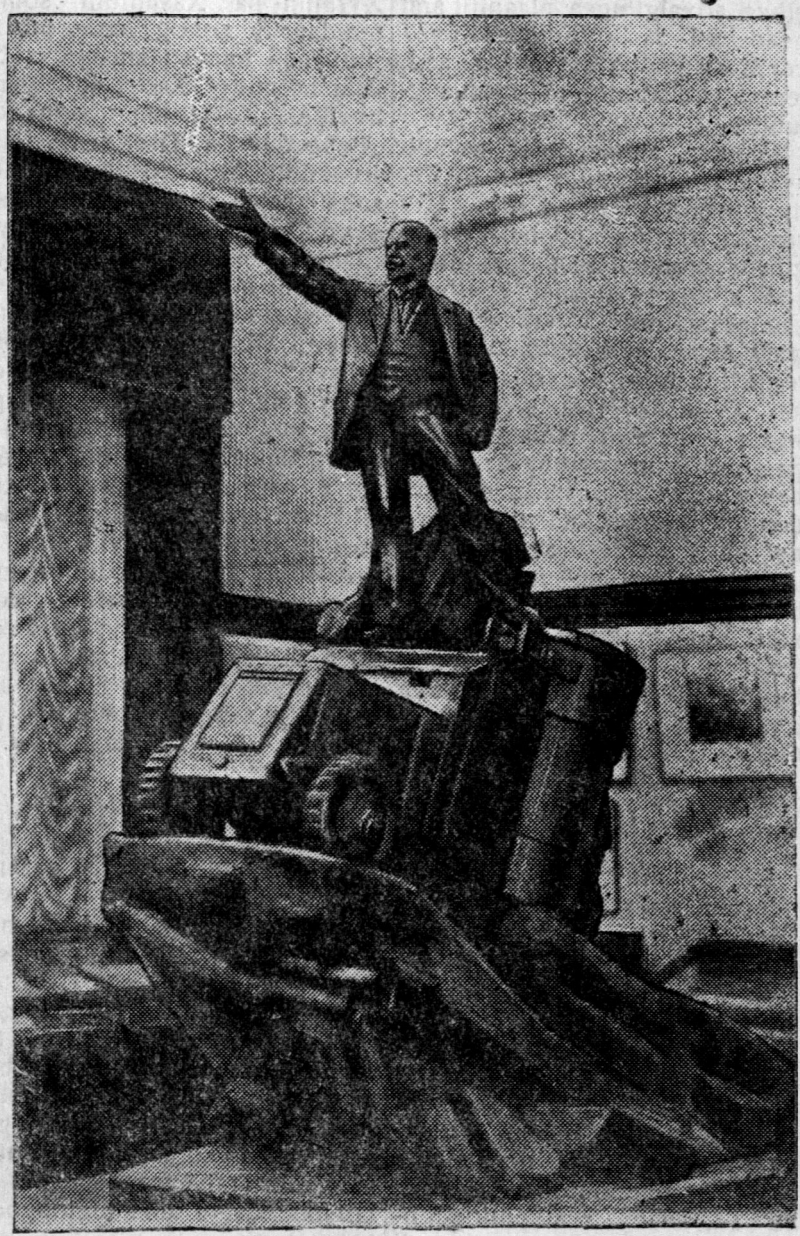
V. I. Lenin bronoviig deere baina. Skytpoor Manizereli xydelmeri.

Moskva, Kreemli. 1939 onoi Janvaariin 19.