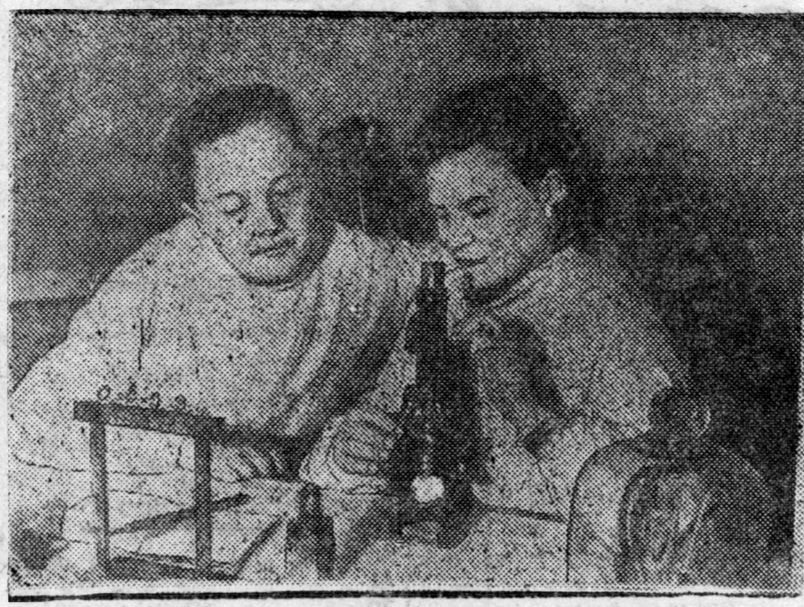
ZURAG DEERE: Ulaan-Ydiin PVZ-oi sine polekllnikiin naqaalbnigijii orologoo nyx Blednitx A.B. ba oraaq A.S. Sutaalova gegsed lavorat ort soo saha salgaza baina. Cernovoi foto.