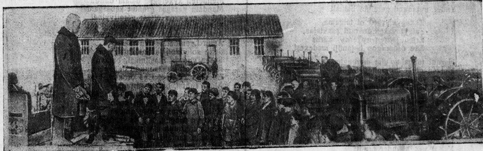
Borgoin xoninoi sovxoosoi traaktor remootololgiin brigadaa xadaa traaktornuudalga remootololgiiji paartiin XVIII sjezdiin neegdexen yder—maartiin 10 boltor dyrygexe ujalga abhan aad, remootololgojoo bolzorhoons urid fevraaliin 22-to dyrygee. ZURAG DEERE: remootololgiin brigadaa xadaa remootololgojoo dyrygexen tuxaidaa miting xeze, sovxoosoi direktor—oordento nyxer N. I. Syybin yge xeleze baina.

kylytyrin tuilaltanuudiji handargaza, galdaza baina. Manai da—nauuka, kylytyre, iskyysste xygzene, badarana. Tedenei- de kapitalis, gyrennyde—barga bydyylig baldal, vaarvarst- va yrgedene. XVII doxi ba XVIII sjezdiin xooronoxi yje xadaa manai oronoi poliitikeske azabai- dalda gaixamsag bajan sobiitnuu daar dyryren baina. Aguu jixe Staalinska Konstituua bolbol ilaltata yngerhen zamai itoo- guudiji zakonodaatelno johoor batadxahan baina.