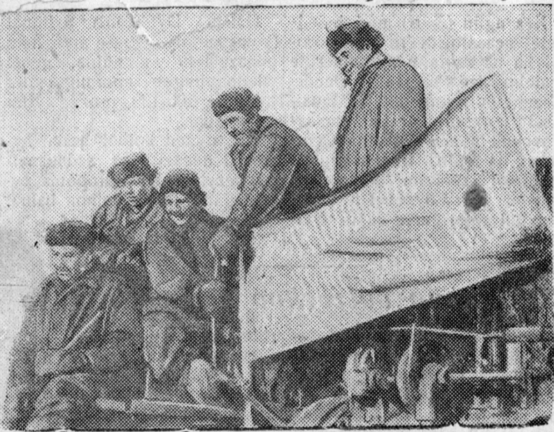
Paartiin XVIII Sjeezdiin nerezete komsomolsko brigada (Zede. Yšeetin MTS) xadaa Sjeezdede beleg bolgozo, „CTZ“ traaktor remootololgiin plaaniiji 150 procent dyrgehen baina.

ũi, xolin orjoloi Domog tyyxete oroin̄ bainaũ, Duugaa duulanam.