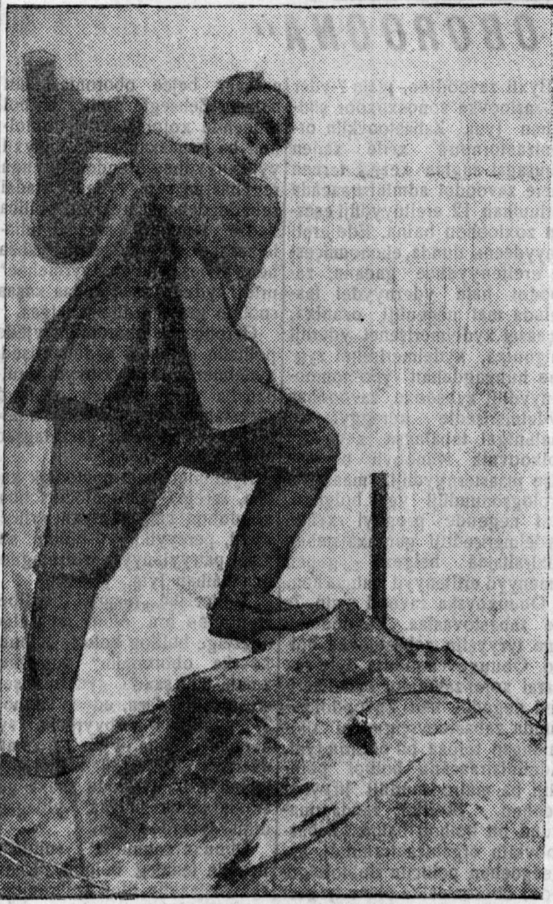
Inkyrdexi syrfosçiguudai brigadiir komsomolec nyxer Liyytikov bolbol gazar tehelelgin xydelmerinyyde talaar plaanaa hara byri 170 proc. dyyrgeze. ZURAG DEERE: Nyx. Liyytikov.