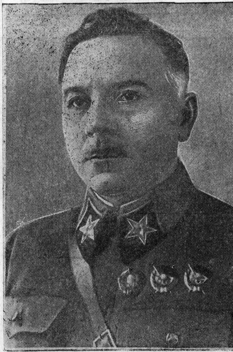
Ulaan Aarmiin kalybtyrne obşuuzivaniin zebseggyd ton jixе xemzegeer urгаа, ene xadaa bojeecyydei ba aarmiin byxii sostaavai kalybtyrnosiin urgalgada egeel aşagtagaar xelegdexe bahans elite batna.

Xydelmerişen - Tariaaşana Ulaan Aarmi bolbol ene zorilgoor, 14 vojeenne akadeeminyydeit ba grazdaanska vyzyenydeit dergede 6 specialьna vojeenne fakylteedyydeit batna, enenei byxii bagtaasa xadaa sag yrgelze huraza baidag komandirnuud, naçaalstviiingood, poliitydelmerileşged, inzeneernyyd, vraqçuud ba busadai toonь xori miangahaa deşe batna.