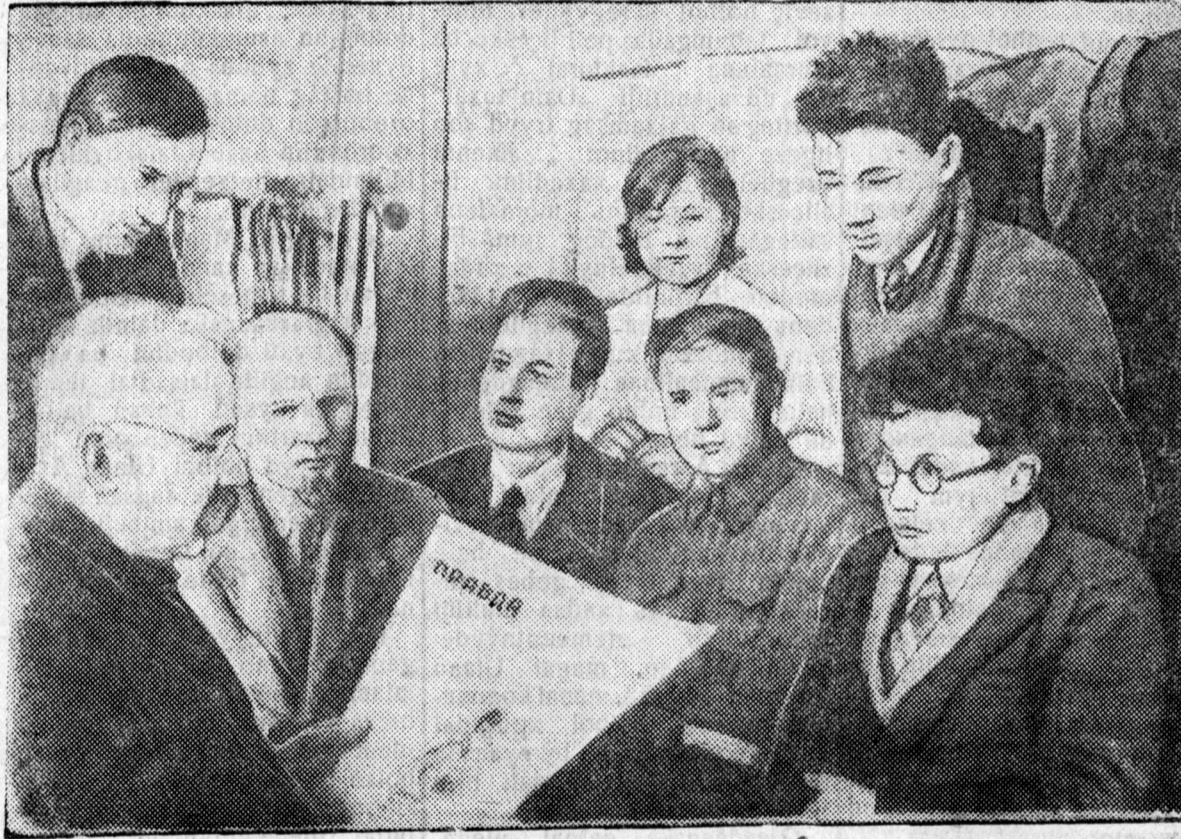
Buriaad-Mongol respbyblikin xydelmerišed, kolxooznuud ba soveed intelligence bolbol Byxesojuuzna Kcmn uniiis (bol'sheviigyydei) Paartiin XVIII sjeezdiin materiaalnuudilji aktivnar yzeze байна. ZURAG DEERE: Zooveteraarna institydei professorsko-prepodavaatel'sko sostaav bolbol BK (b) P-iin XVIII sjeezd deere nyx. Staalina xelehen otčotno doklaadilji unšaza

bol'sheviigyydei zebsegel xyseer, soveed aarmiin bodoto bojevot šadabari tuxai, tere nei komandirnuudal ba poliitišeske kaardnuudal baidal tuxai oehediingee xariuuji belen olzodo duralgadai araniurgandans, bišeed tabiaa.