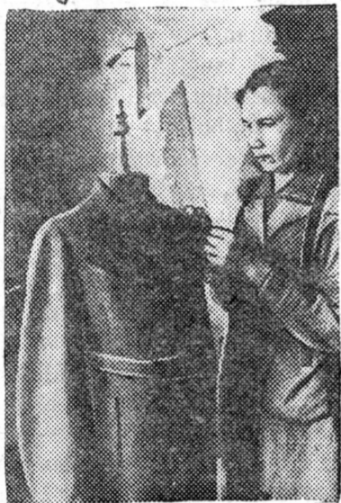
ZURAG DEERE: „Koooperaator komsomoolc“ promarteeliin (Ulaan-Yde erxim maaster-portniixa nyxer Balaandina noormojoo 120 % xyrtter dyrgedeg.

partilina exin organizaaca bolbol kandidaaduudai teoretičeske xemzeeti deeselylyxe jabadaldan anxaralaa tabinagy. Paartiin istoriitj yze xe kryzoog ba-bašji xydelmerilnegyi. Paartiin Kabaanskiin aikoom bolbol kandidaaduudal nege udaa sovešcaani yn gergoed eneegeere xizagaarlahan baina.