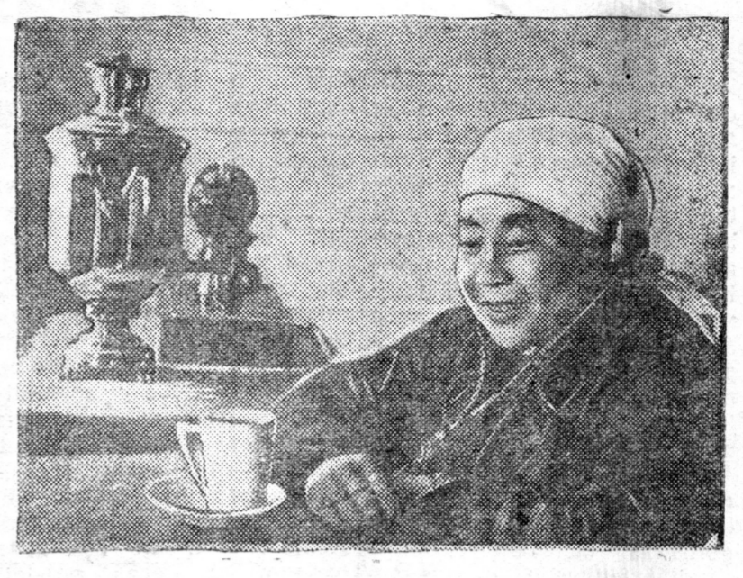
ZURAG DEERE: BXAV-de kandidaad, Teel'manei ne-remzete kolxoozoi тугалша nyxer Будаајева радио сaг-наза байна.

Kolxoozoi шне klyub болбол kolxoozигуудai сyлөө сaгтaа кyльтyрнeеr, xыxийн бaртaлaй-гaар аmарxa гaзapанb мyn болxо. Илeе oрoндo, манai Aгyуjxe eдe oрoндo, xynyyд тyxaй, kolxoozигууд тyxaй стaалинска аnхapал xadaa yдeр-бyри бeлeжyлeгдeдe бaгaa илeе oрoндo, Социализмиin aгyу-jxe дoкyмeнт—Стaалинска Kонституциin нapaн дoрo, азa-хуухaнb, xyдeлмeрлxеnб, аmарxаnб урмaтaшji, бaртaлaшji, oмoгopxолтoшji байна даал