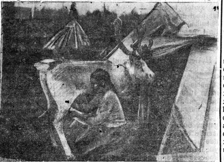
Xoito-Baigalai аймагал евеенкeнүүд болбол kolxoozdo хамтарча хууризахан азahuудaлтaй болзо байна. ZURAG DEERE: „И табанзил“ kolxoozoi агнууша Шаангa хандагай хааза байна.

Харуулгача редакторай орологшо Г. ДАШИЦЫРЕНОВ.