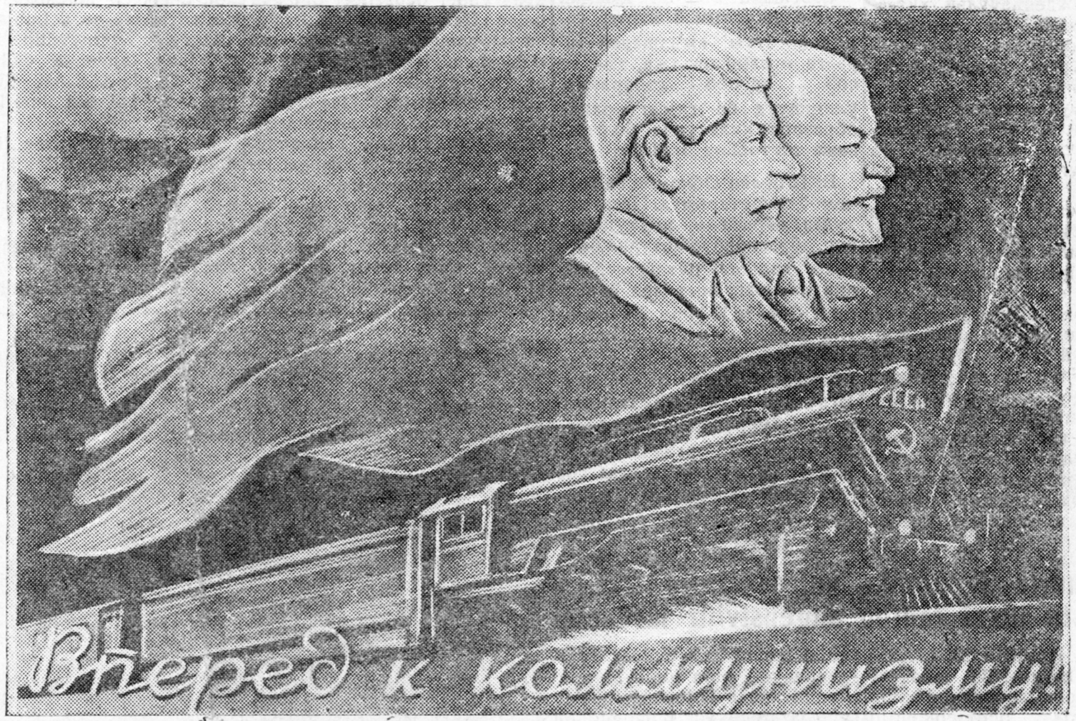
ZURAG DEERE: „Iskyystvoo“ izdaatelstvaar gargagdahan „Kommuniizm teeše urağšaa“ geze plakaad, xydooznig A. Vološinai xydelmeri.