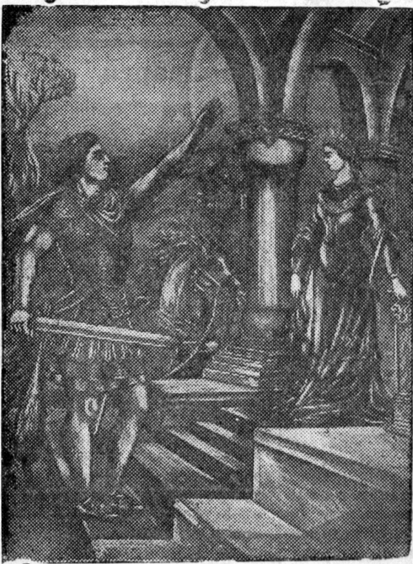
Өөрынгөө хани Хандут—Хатунай урда тэрээнэй эсэргин дайсадыс үгэйхээ тухай Давидай тангариг (худ А. Мамаджаниян).