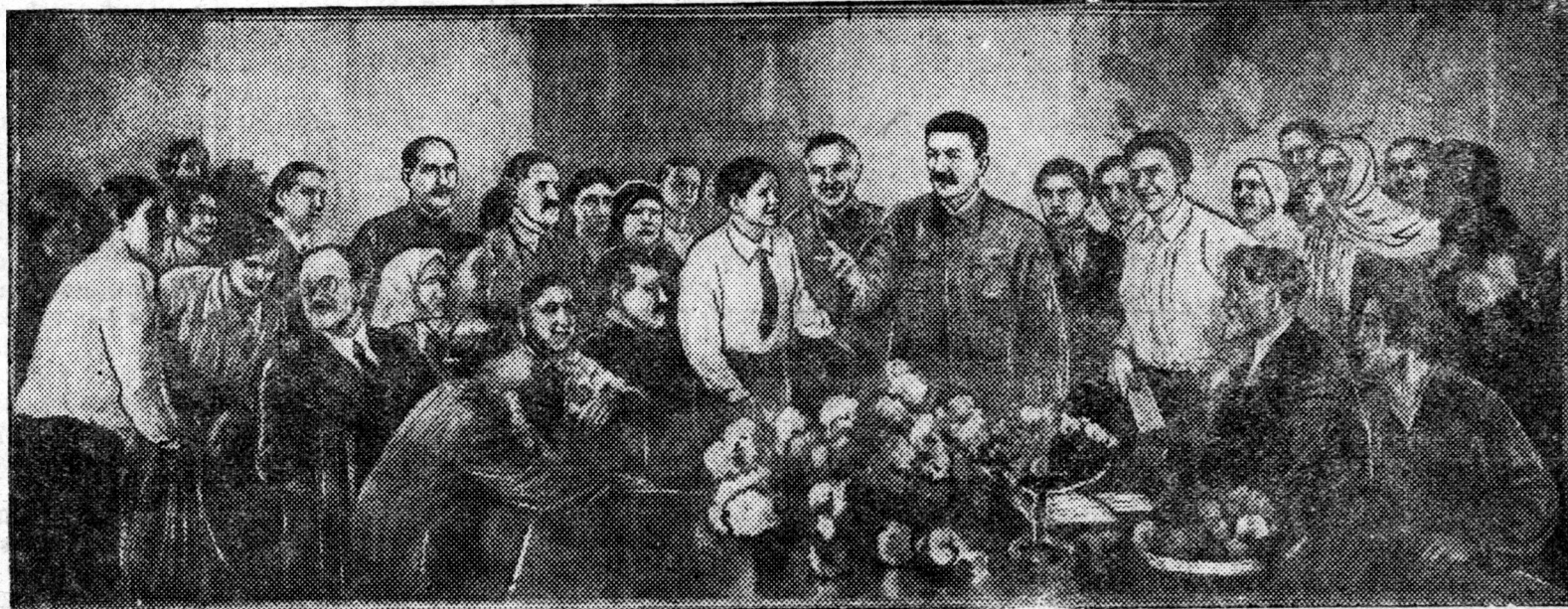
Хүдөө ажахын Бүхэсоюзна выставка. ЗУРАГ ДЭЭРЭ: Парти ба правительствын хүтэлбэрлэгшэд хадаа „Түрүүшын табанзуутан—свекловичнигуудтай Кремльдэ уулзалга“ гэгһэн, художник Серовой зураг („Сахарная свекла“ павильон).

Орондоо дүүрэн намилзана! Бата хайхан орондом Баяр жаргал бадарнал, Барандаа нүхэд түрүүлээл, Баян байдалнай хүгжэнэл.