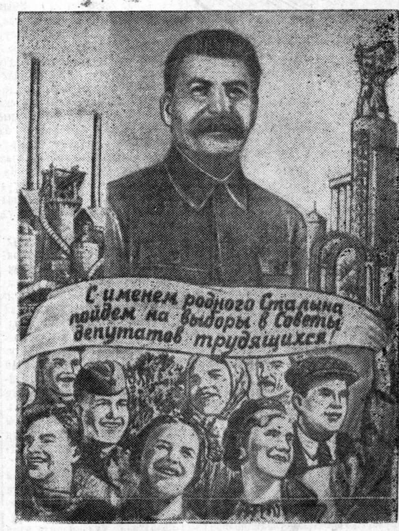
Барков ба Лисевичин зураг.

Берлин, декабриин 14. (ТАСС). Абаралгын хүдэлмэринүуд хадаа тон эхэ бэрхшээлдэ оруулагдаһан байна, юндэд гэхэдэ фабрика төөшө, гансахан лэ противогастайгаар ошожо болохо байгаа. Олон хүнүүд хорологдоһон ба дүрэнэй байна. Төлэралгын болоһон шалтагаан тухай, юунышэ тодоруулагдаагүй.