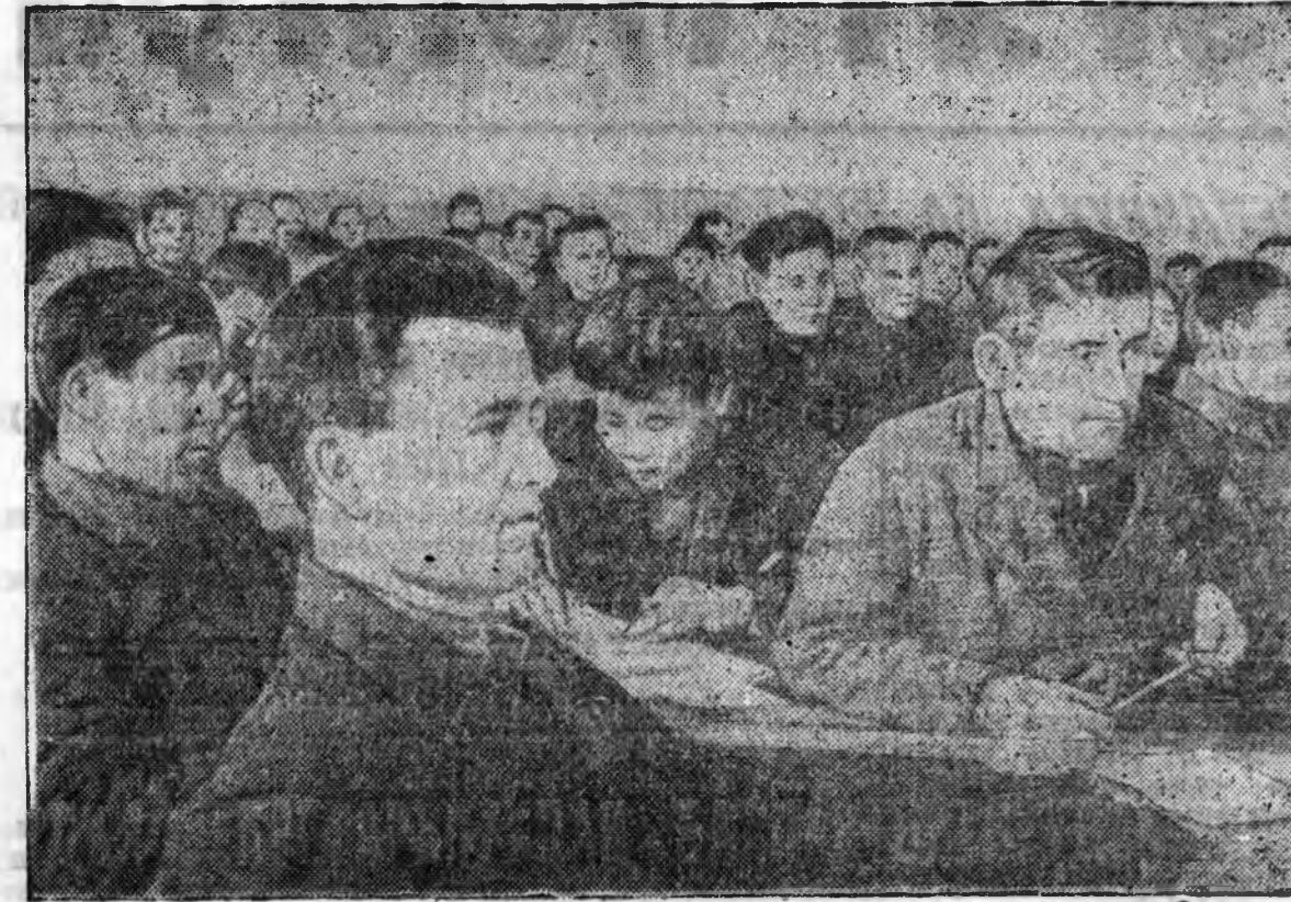
ЗУРАГ ДЭЭРЭ: ВМАССР-эй колхозуудай парторганизацинуудай секретарьнуудай областной совещаниин зал соо.

ВВП(б)-эй ЦБ-гэй тогтоолнууды, нүсэр Сталиной заабариууды бөөлүүлжэ, партиин Обкомой хүтэбэрээр, 1940 ондо олхозойгоо дохдые хоёр миллион түгэригтэ хүргэжэ хүсэл шадахабди.