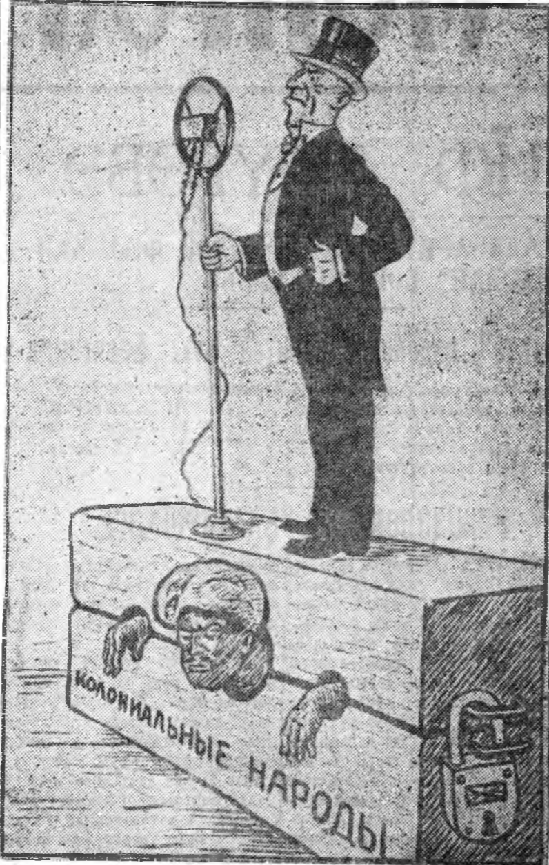
«Демократин» түлөө тэмсэеые соносходог трибуна. В. Лисевичын зураг.