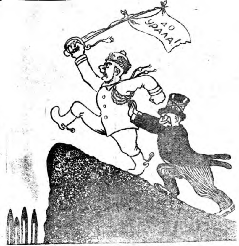
„Английска түлхигшэ“ М. Отаровай зураг.