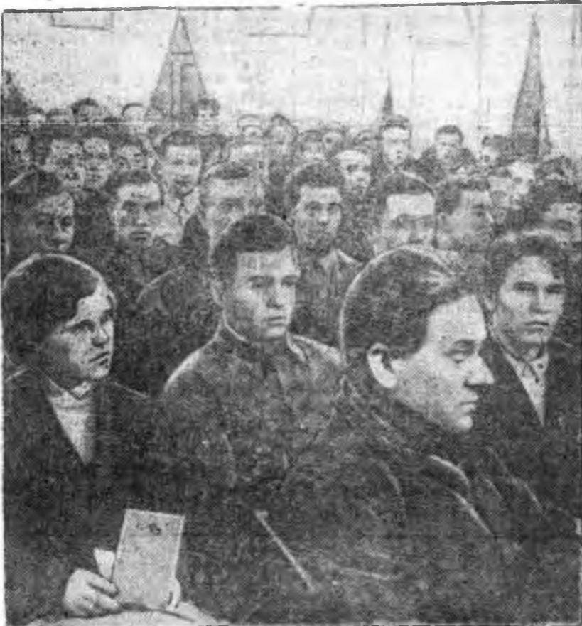
ВМАССР-эй хэлхээ Школыной управления дэргэдхи парторганизацин отчетно-хунгалтын суглаан. ЗУРАГ ДЭЭРЭ: Коммунистууд болбол партбюрогой секретарин доклад тухаа премие соносожо байна.

Социалистическэ соревнованин түрүүшүүд—стахановууд, шалгалдамал большевигүүд, партийна хүдэлмэрине хүтэлбэрилгэдэ дэбжүүлэгдэ.