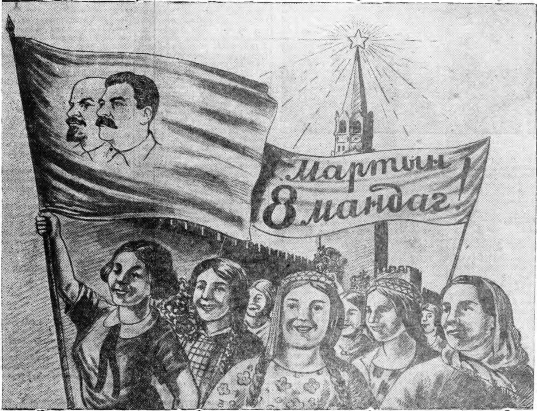
Художник Чашинай зураг.

Мартын 5-най үдэр, Карельскэ перешеек дээрэ, Выборгскэ за-