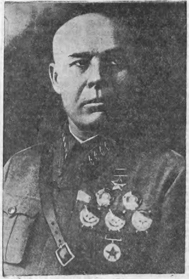
ЗУРАГ ДЭЭРЭ: СССР-эй Оборонин Арадай Комиссар, Советскэ Союзай Маршал, Советскэ Союзай Герой С. К. Тимошенко.