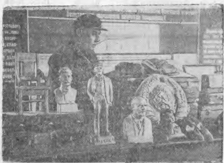
ЗУРАГ ДЭЭРЭ: Кяхтын аймагдахи промкооперацинуудай бүтөөдэг үргэм хэрэглээлэй эдлэлнүүдэй выставкэ.