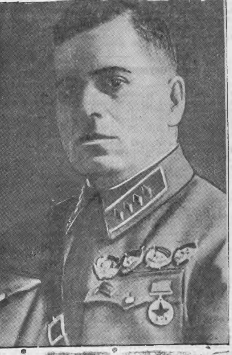
Генерал-полковник Г. М. Штерн

Харилсан туһалалсаха тухай советско-латвийска пактын баталһанай Һүүлээр, Латви хадаа гүсэд прибалтийска гүрэнүүдтэй баталһан военнэ союзна гараха ба тингэжэ энэ военнэ союз усадхагдаха байжа гэжэ советскэ правительство нанһан болго. Энээнэй орондо, Латви болбол, бусад прибалтийска гүрэнүүдтээ хамта, дээрэ заагданан военнэ союзые бүхэжүүлжэ ба үргэдхэжэ байна, энээн тухай имэнууд фактууд гэршэнэ, гээбэл: Эстони ба Литвотэй үргэн военнэ союзые оформлялхын тулада, гурбан прибалтийска гүрэнүүдтэй хоёр нууса конференцинуудые 1939 оной декабрьда ба 1940 оной мартда зарлагга; СССР-нэ нуусаар бэлүүлэгдэдэг, Латви, Эстони ба Литвын генерална штабуудай холбоо шангалдагга; Таллин городто английска, француска ба немекэ хэзэнүүд дээрэ хэблэгдэдэг, „Речь Балтик“ гэжэ нэрэтэй, энэ балтийска