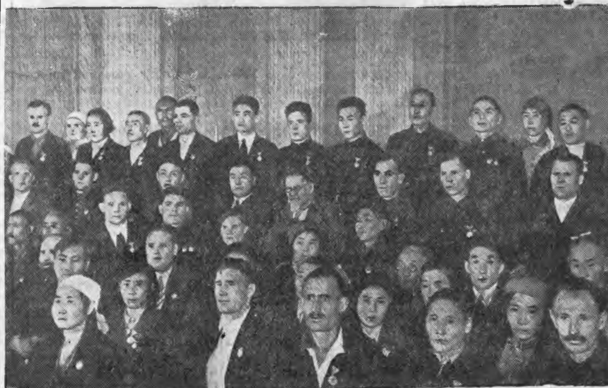
Июнийн 10-да СССР-эй Верховно Советэй Президиумэй түрүүдэгшэ М. И. Калинин болбол шагнагдагшадта СССР-эй орденууд ба медальнуудыг барюулба. ЗУРАГ ДЭЭРЭ: Нүх. М. И. Калинин болбол Бурят-Монголой АССР-эй хүдөө ажахын түрүүшүүлэй дунда.

Арад массын халуун анхарал ба оролдолгоор хүрээлэгдгшэ, депутатууд—арадай тунамаршад урда ехөнүүд ба хувдэтай зоригонуд табигдана. Тэднэр болбол социалистическэ Бурят-Монголой улам хүсэтэ бадаралтын түлөө, ажахын ба культурын бүхы фронтнууд дээрэ шэнэ амжалтануудай түлөө олониятын эрмэлзүүлгэ ба активностие большевистскээр толгойлохы байһандань ямаршье нэжэг байхагүй.