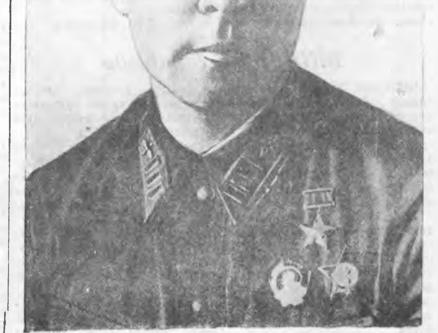
Советскэ Союзай Герой, полковник Иван Степанович Сухов..

Августын 18-най үдэр, германскы авиациин довтолхо үедэ, тэдэнэй 152 самолөдүүд унагагдэб.