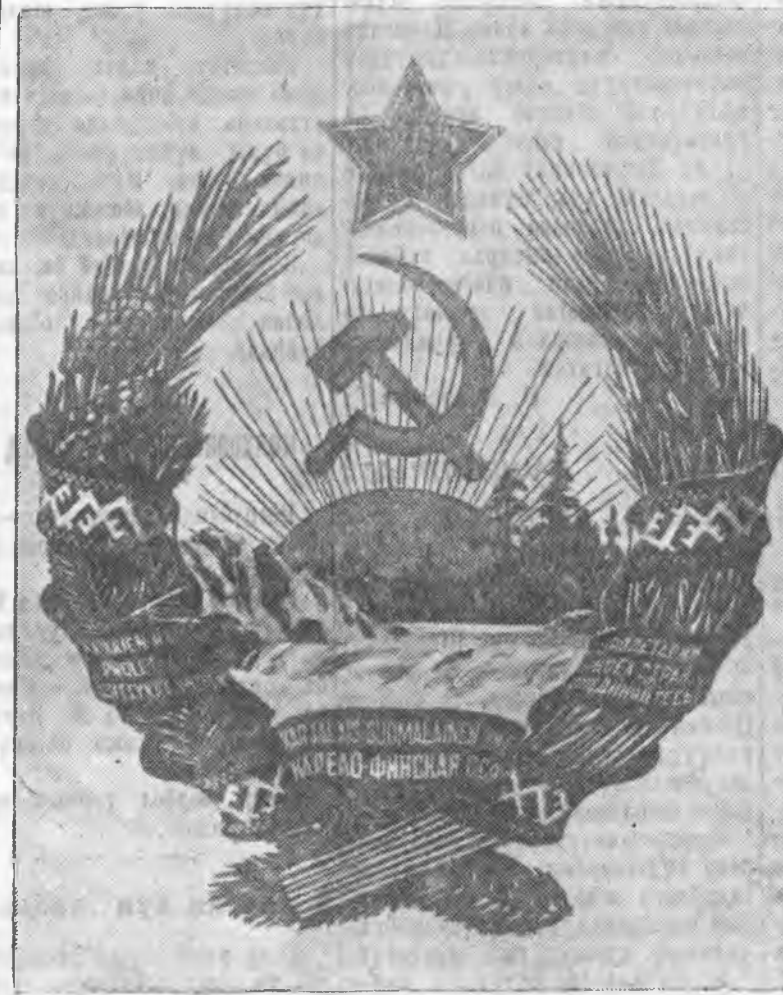
ЗУРАГ ДЭЭРЭ: Карело-Финскэ ССР-эй гүрэнэй герб.

Электростанцинуудыг ремонтлодо зохино анхарал табиагүй тэрэ нютагай Советүүдшэ Наркомхозтой адлар харюусаха байна. Арад зонниг электрицкэ гэрлээр хангалга тон шухала хэрэг, энээндэ нютагай Советэй хүдэлмэрилэгшэ бүхэн анхарал табижа уялгагай.