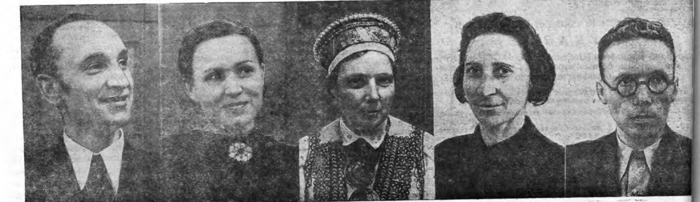
СССР-эй Верховно Советтэ депутат (Литовско ССР-һээ) Ю. Палецис. СССР-эй Верховно Советтэ депутат (Литовско ССР-һээ) Саламея Нерис. СССР-эй Верховно Советтэ депутат (Латвийн ССР-һээ) Палдыня-Русис. СССР-эй Верховно Советтэ депутат (Таллинска хойто округһоо) Ю. Тельман. (Эстонско ССР-һээ) И. Лауристин.