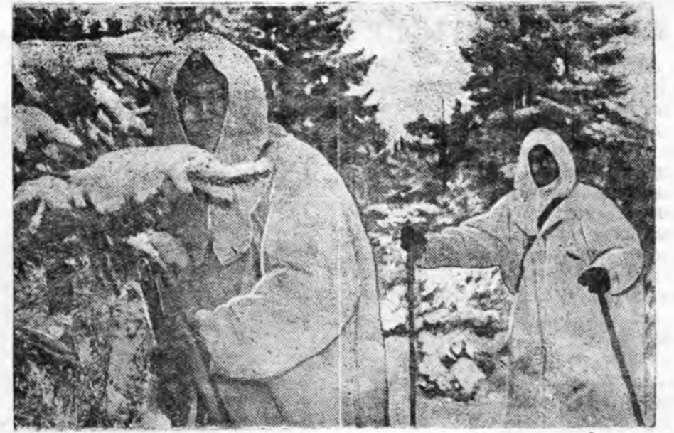
ЗУРАГ ДЭЭРЭ: Н-скэ частини бөөцүүд санын ябалгада.

Игорка мүнөө Балтийн далай хүрэтэр советско-германска хилэ тухайда СССР ба Германи хоорондын договор хадаа 1941 оной хэлсэгүүд соо топ шухаланы болоно, энэниин Арадай Комиссарнарай Советдэй Түрүүлэгшэ нүхэр В. М. Молотов ба Германиян посол Г. В. Шулленбург гэгшэд баталжа. Тунхаглагдахан договорхоо