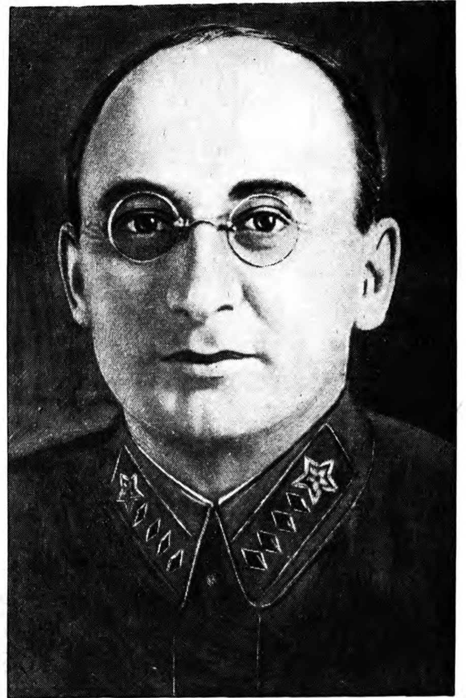
СССР-эй дотоодын хэрэгүүдэй Арадай Комиссар, СССР-эй Арадай Комиссар- нарай Советдэй түрүүлгшын орологшо, СССР-эй гүрэнэй аюулгүйе сахиха ге- неральна Комиссар нүхэр Л. П. Берия.