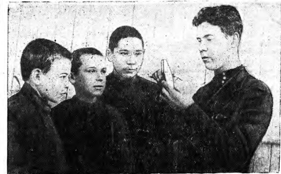
ЗУРАГ ДЭЭРЭ: Түмэрзамай №1 училищин инструментальна группын нуурагшад.