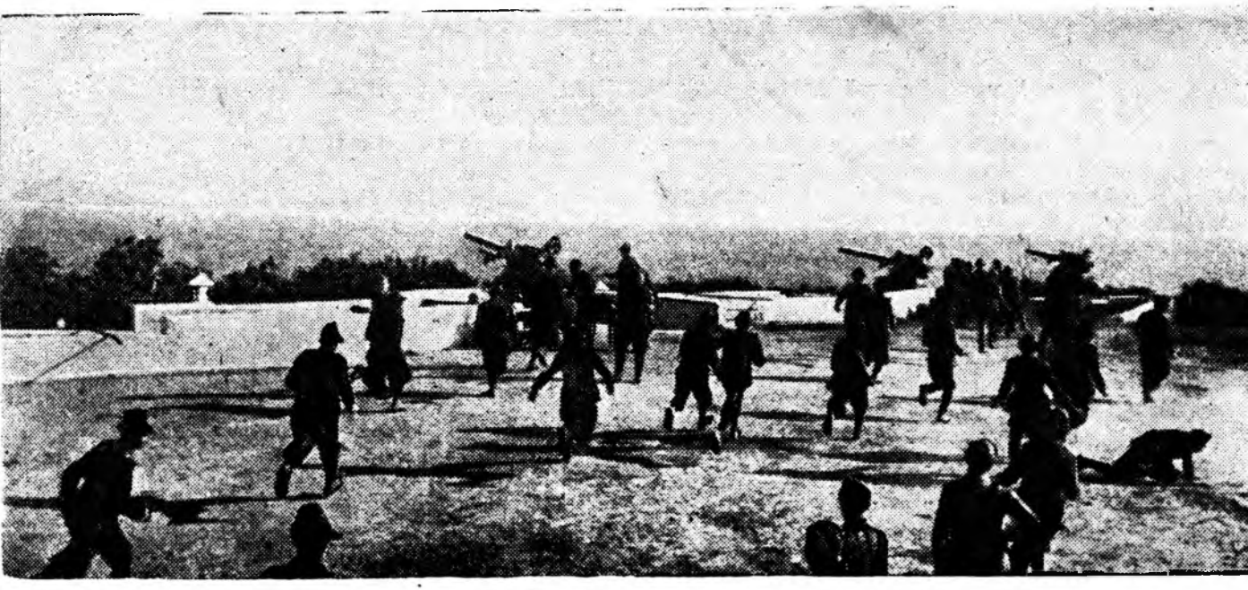
Англи ба Итали хоорондын дайн. ЗУРАГ ДЭЭРЭ: Италийн эрьшадарай артиллери.