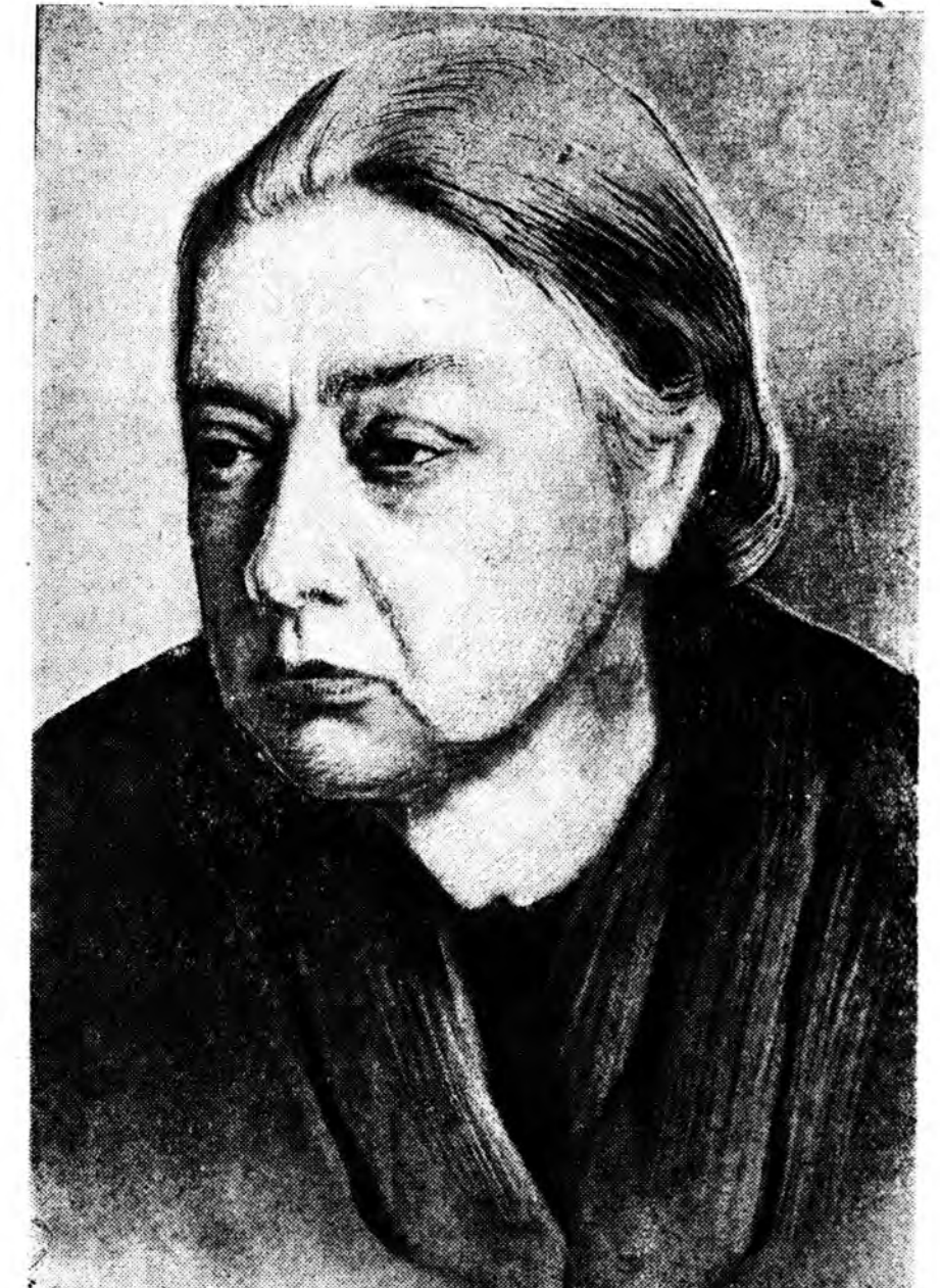
Агууехэ Лениной үнэн гүналагше, большевикскэ партиин хушанай член Н. К. Крупскийн найа бараһаар хоёр жэл гүйсэхэнэ. ЗУРАГ ДЭЭРЭ: Н. К. Крупскийн портрет.