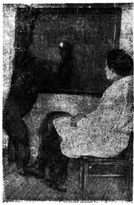
Павлова тосгондо (Ленинградска область) байгаа научна лабораторияда...