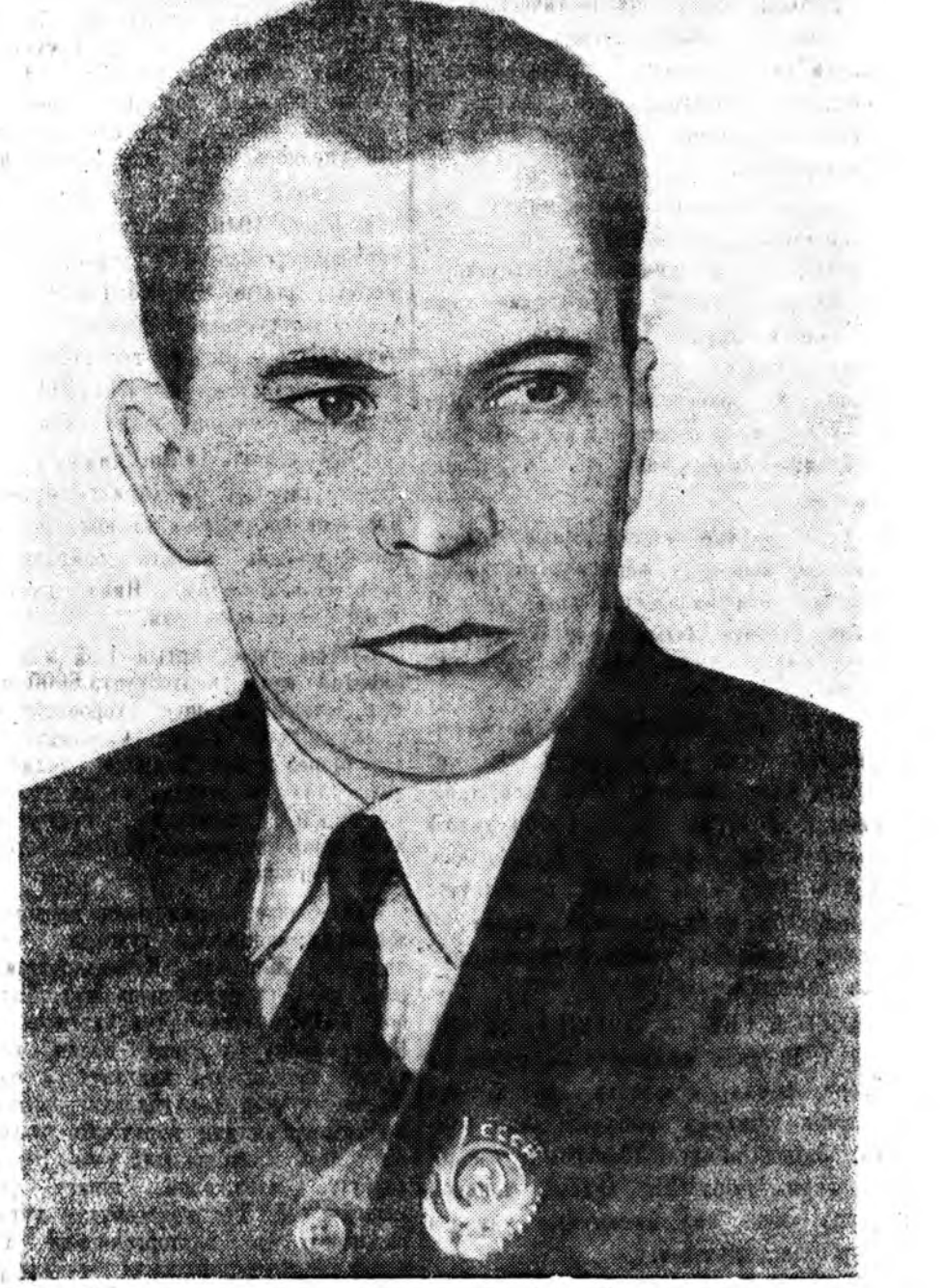
ЗУРАГ ДЭЭРЭ: СССР-эй Ардай Комиссарнарай Советдэй Түрүүлэгшын оролошо ба СССР-эй Госпланай түрүүлэгшэ Максим Захарович Сабуров.

Д. ЦЫРЕНЖАПОВ—Энгалсын нэрэмжэтэ колхозой түрүүлэгшэ.