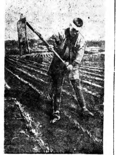
ЗУРАГ ДЭЭРЭ: Японин гарышан газартаряалангай хүдэлмэри дээрэ.