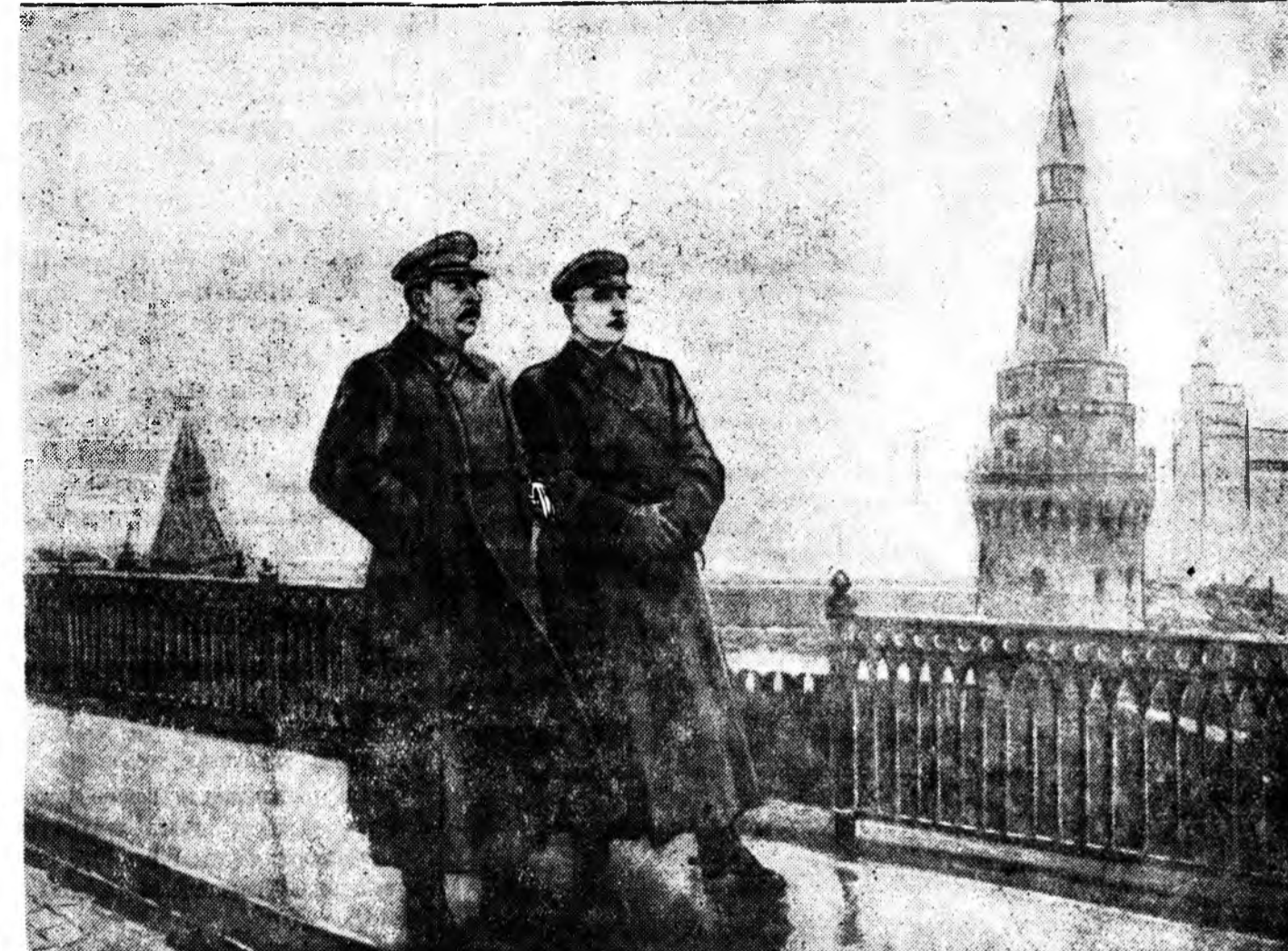
ЗУРАГ ДЭЭРЭ: Искусствын габьяата деятель А. М. Герасимовой, «Сталин 61 Ворошилов Кремль соо» гэһэн зураг. Энэ зурагай түлөө Сталинсангэдэхи шатын шагнал үгтэн байна.