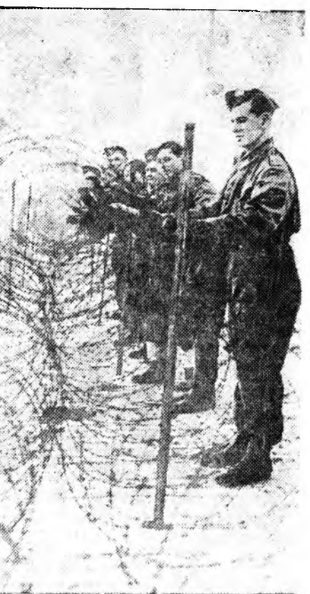
ЗУРАГ ДЭЭРЭ: Англин урда эрвэ шадарай проволочно хаалта.

Алдуу гаргаһан зэмтэ шурунууд харюусалгада хабаадуулагдаба.