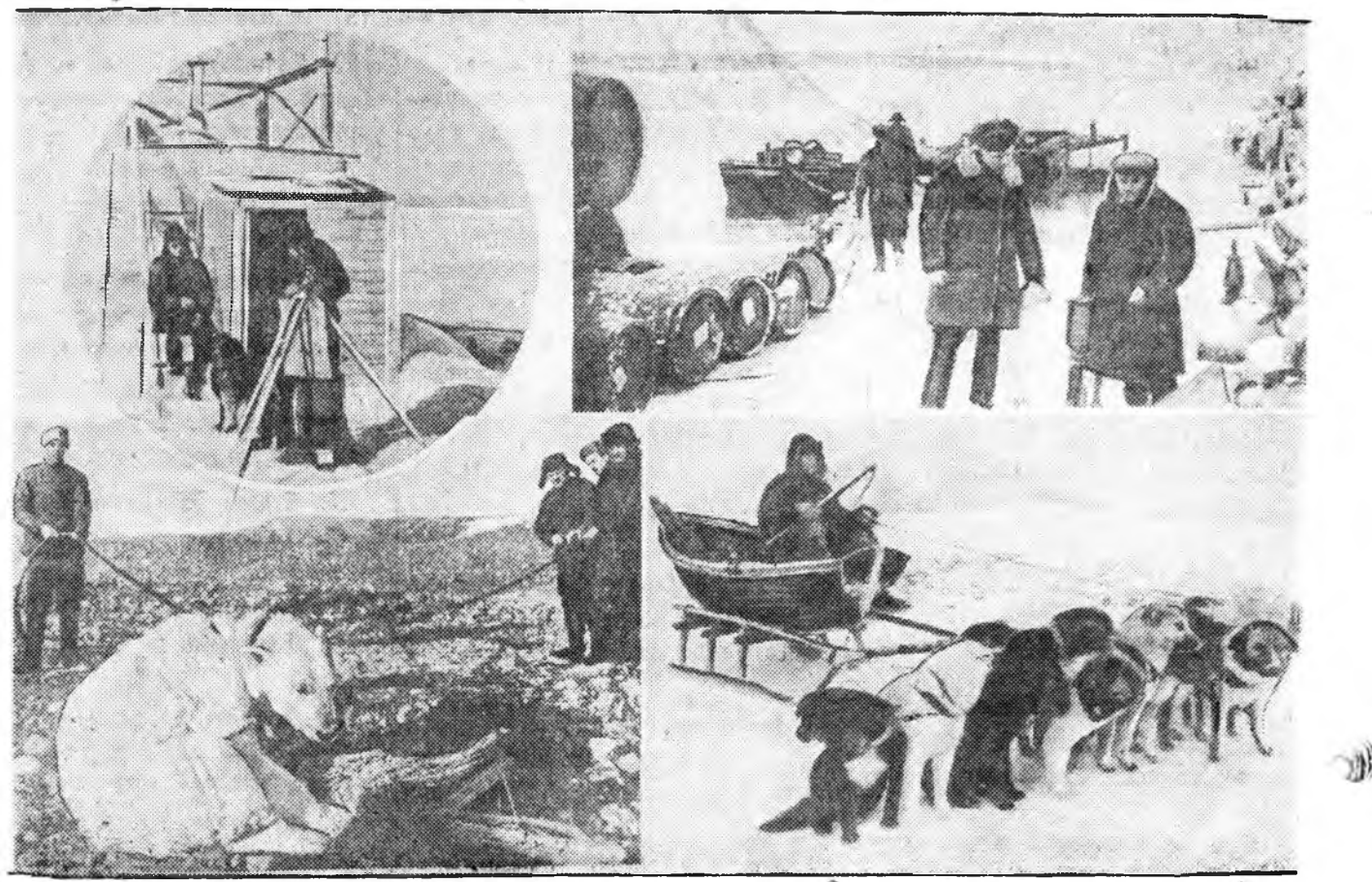
ЗУРАГ ДЭЭРЭ: Зүүн талаһаа (дээдэ захадань) актинометрическэ шэнжлэл, доодо захадань — поларна станциин хүдэлмэрилгшэд далайһаа барихан сагаан гүрөөхтэйгөө; баруун талаһаа (дээдэ захадань) Желани гэжэ кошуугаар жэлдээ нэгэ гарагад пароходһоо ашаа тушаажа абалга; доодо захадань — далайн ангыгэ агналгада агуушаа гаража ябана.