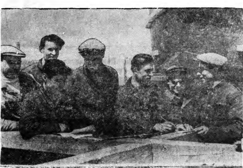
ЗУРАГ ДЭЭРЭ: Улан-Удэ городой Судна заһабарилалгын заводой котельнигүүдэй түрүү стахановска бригадынхид Гурбадугаар Табанижэлэй (дүрбэдэхи жэлэй гаргалга) уриһаламжы бэшүүлжэ байна.

А. Шулунов. ГЭРЭЙ ЗЭЭН ЭХЭЭРНҮҮД ЭДИХИТЭЙГЭЭР ХАБААДАЛСАБА. БМАССР-эй Верховно Советэй Президиумэй 6 агитаторнууд участогууд дээрэ гаража гурбадахы табанижэлэй (дүрбэдэхи жэлэй гаргалга) гүрэнэй уриһаламжа гаргах тухайда ССР Союзай Арадай Комиссарнарай Советэй тогтоолоор хөөрөлдөө үнгэргэбэ. Эндэ хабаадаһан гэрэй эзэн 18 эхөнэр хамта 535 түхэригтэ уриһаламжа захилба. С. Цыжибон.