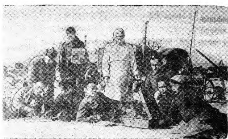
Зураг дээрэ: Хорин аймагай «Интернационал» колхоздо хүдэлмэрилдэг, нүх. Рызыновай хүтэлбарилдэг тракторна бригада полевои стан дээрэ амаржа байна.

Тус колхоз болбол энэ жэлдэ нэгэ гектар газарта арбуз тариха гэжэ шийдхэнэ байна. Мүнөө үедэ арбузын парнигуудта найнаар ургажа байха юм.