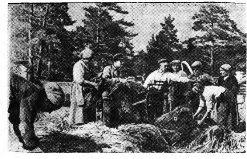
Кумысолечебницын туһалбарин ажахыда. ЗУРАГ ДЭЭРЭ: Эргын йонгынне колхозно базар дээрэ абаашама худалдахаан ашаалма байна.

Колхозно үйлдбэри дээрэ түрүү үүргэ эзэлжэ, стахановска ажалай эрхим жэшээмүүдые харуулаг коммунистууд аймагай бусадшые колхозуута олон. КОНДРАТЮКОВ Г.—ВКП(б)-гэй Селенгын айкомой пропагандист.