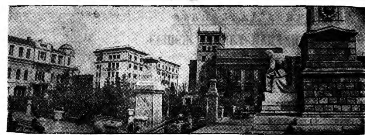
Советскэ Союзай городуудта. ЗУРАГ ДЭЭРЭ: Уфа городской Ленинэй улица.

Юнайтэд пресс агентствын Мадридахи корреспондентын Ис-